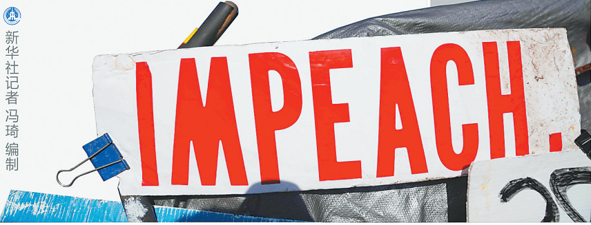
新华社记者冯琦编制