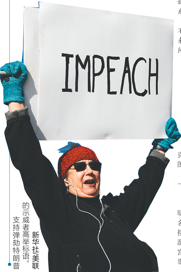
示威者高举标语,支持弹劾特朗普