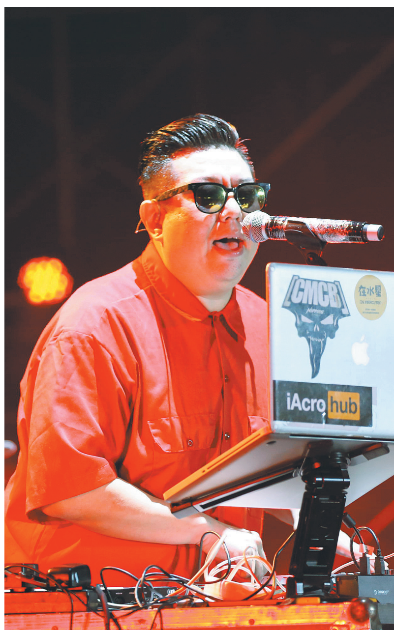
歌手和现场乐迷共同开启音乐狂欢。