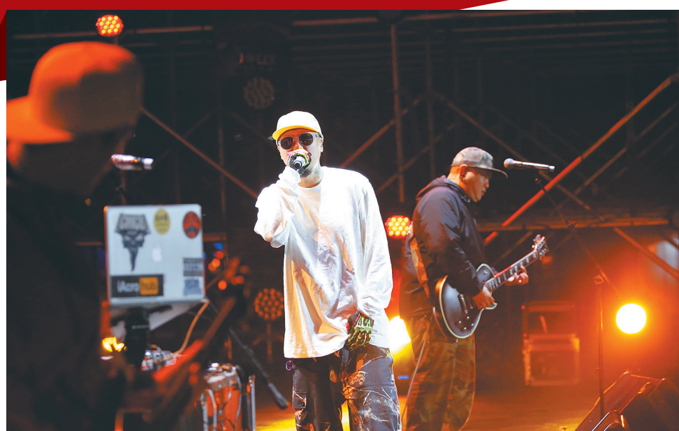
红珊瑚音乐节，乐队为现场乐迷带来精彩演唱。

耀眼的灯光舞台，躁动的鼓点氛围，激情的呐喊摇摆…… 12月21日，海口的天空飘起了绵绵细雨，但雨水丝毫不减2019海南红珊瑚国际音乐节的热度，挡不住乐迷的热情与激情。耀眼“珊瑚红”，是燃烧在椰城冬天的音乐火焰！