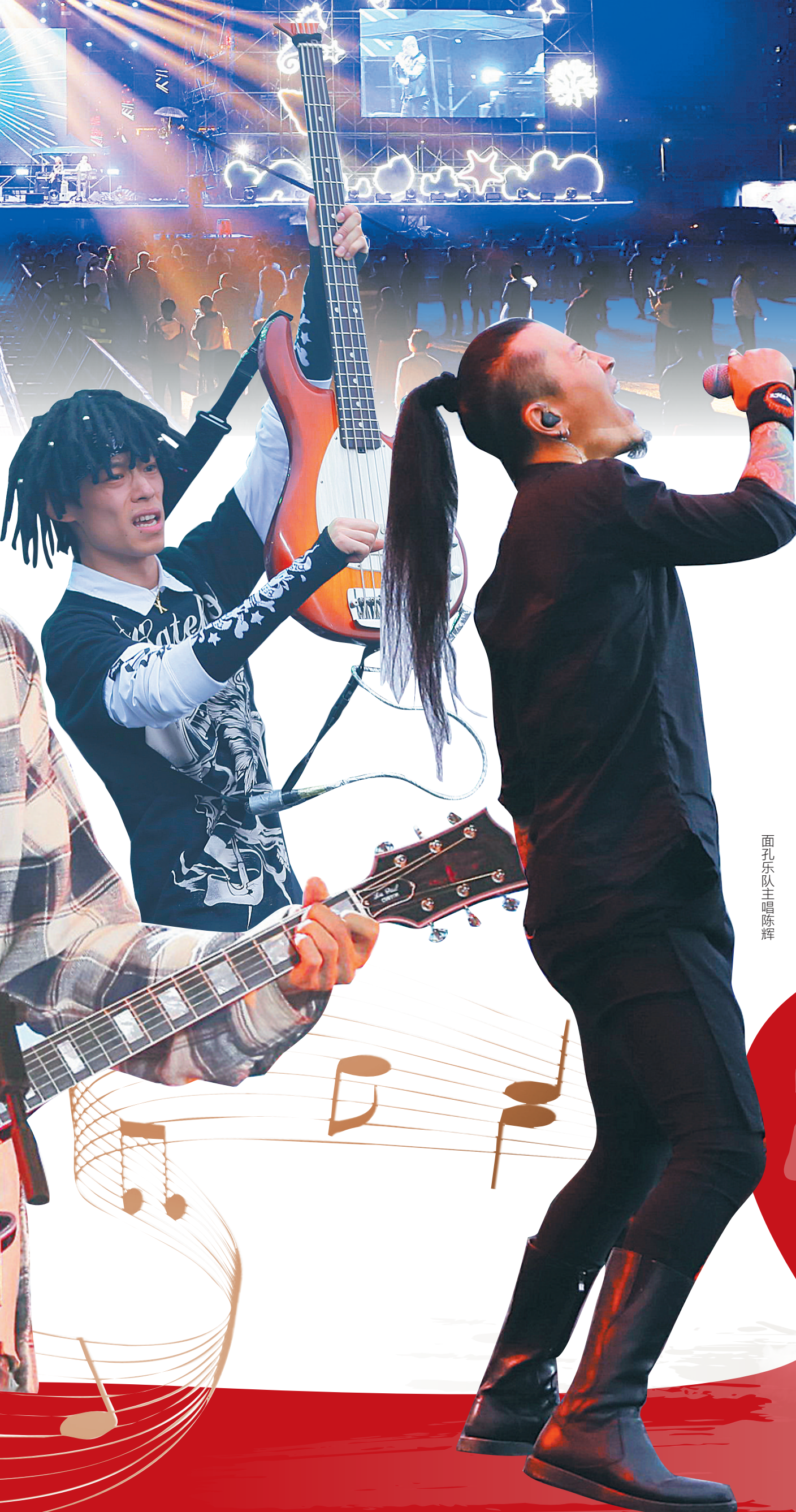
面孔乐队主唱陈辉