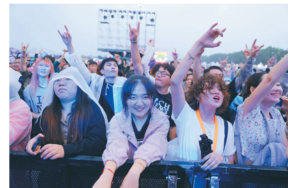
红珊瑚音乐节现场气氛热烈，乐迷们举着手随着节拍摆动。