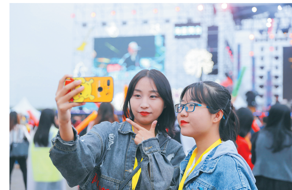
乐迷在红珊瑚音乐节现场自拍。