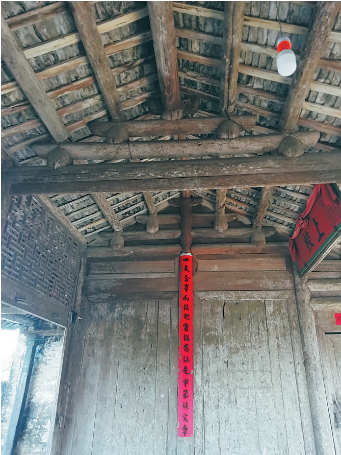
莫氏小宗祖祠为清代乾隆年间建筑，隔板和结构都有很强的时代感。

莫宣宝青年的时候，正是蒙元王朝风雨飘摇时期，政治黑暗腐败，横征暴敛，苛捐杂税繁多，各种社会矛盾不断激发，百姓流离失所，农民起义此起彼伏，地方流寇横行。元朝末年，明朝的军队尚未平定海南，文昌贼陈子瑚趁机发动暴乱，周边大多的州县都被俘虏人口和抢劫财物，势甚猖獗，并攻围当时的南建州（1329—1369，后恢复为定安县），莫宣宝虽无官职，赋闲在家，但关心民瘼，向知州王廷金建议保卫南建州一事，然而王廷金一意孤行，最后兵败逃走。