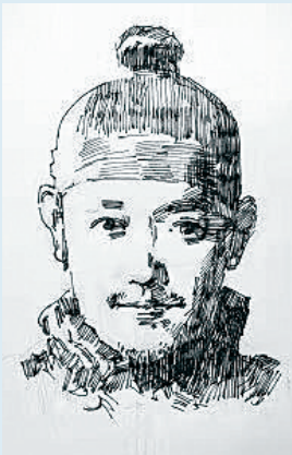
莫宣宝画像。

定安是海南莫氏的显赫之地，从明代十四世莫子瑚开科中举（1417年）开始，人文荟萃，科甲鼎盛，才俊辈出，明清两朝创造了“一里三进士、十八举人、一千二百五十个秀才”的传奇，也走出了多位政绩卓著、造福一方的清官廉吏。但也有一些贤人不为后人所熟知，被明太祖朱元璋赐为“义士”的莫宣宝就是其中之一。