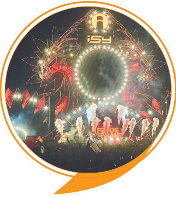
第三届三亚国际音乐节。本报记者 封烁摄

今年跨年,来海南的游客还能够通过另一种方式来感受艺术之美。对于喜欢静静欣赏音乐的朋友来说,听一场高水平的跨年音乐会是不错的选择。海口湾演艺中心升级改造后,将在2019年12月31日以全新面貌推出首演,献礼2019年(第20届)海南国际旅游岛欢乐节——享誉世界的指挥家、作曲家谭盾将携纽约巴德爱乐乐团和中国交响乐团合唱团近两百名艺术家,在跨年夜带来其最新力作大型音乐会《敦煌·慈悲颂》,与市民游客共迎新年。《敦煌·慈悲颂》是谭盾历时六年的呕心力作,创作灵感来源于丝绸之路上的敦煌石窟壁画等深具中国