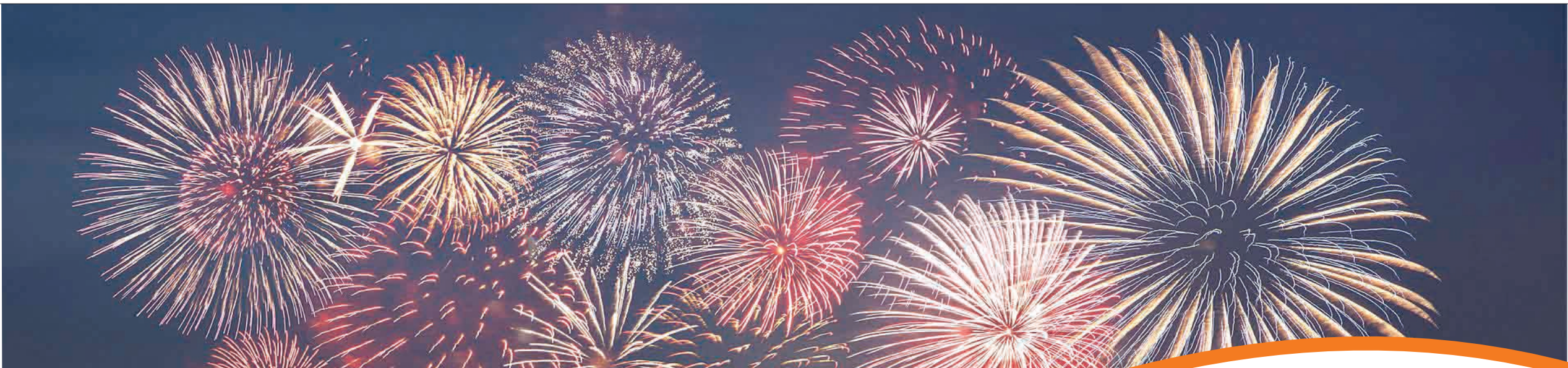
跨年焰火。(资料图片)