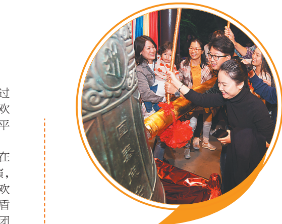
南山每年都会举行撞钟祈福迎新活动。

跨年夜的海口或许属于音乐。厦门爱乐乐团也将于2019年12月31日至2020年1月1日,在海南省歌舞剧院为市民游客带来交响乐盛宴。此次,厦门爱乐乐团的乐手们在为海南观众带来多首中外优秀经典曲目的同时,是否还会精心挑选富有海南特色的曲目?观众朋友可以拭目以待。