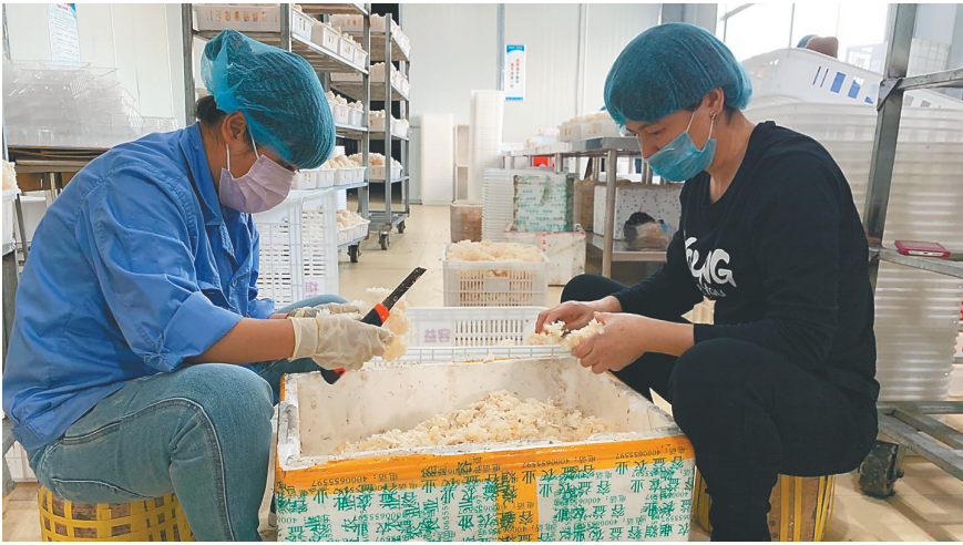
近日,在容益(海南)农业开发有限公司就业扶贫车间,村民正在清理刚刚培养出来的绣球菌。

据介绍,今年东方市在天安乡、大田镇等7个乡镇分别建立10个就业扶贫车间,加上去年建立的3个扶贫车间,目前,东方市一共有13个就业扶贫车间(基地),就近安排贫困户294人就业,实现了贫困劳动力在家门口务工增收。