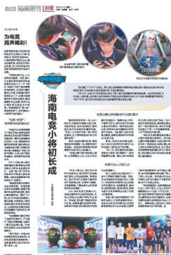
2019年8月19日《海南周刊》B03版面图