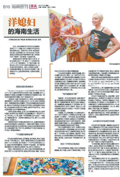
2019年4月22日《海南周刊》B10版面图