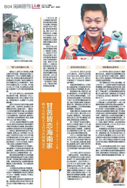
2019年8月5日《海南周刊》B04版面图