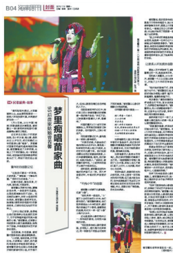
2019年1月14日《海南周刊》B04版面图