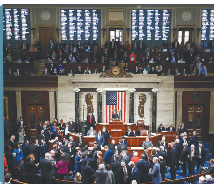
12月18日,在美国首都华盛顿,美国国会众议院就针对总统特朗普的弹劾条款进行投票。