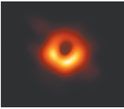
4月10日,人类史上首张黑洞照片发布。

4月10日,由全球科研人员合作开展的“事件视界望远镜”项目发布首张黑洞图片——一个中心为黑色、看上去像甜甜圈的明亮环状结构,黑色部分为黑洞“阴影”,明亮部分是黑洞周围吸积盘。人类终于“看到”曾被认为不可见的黑洞。包括中国在内,全球多国200多名科研人员参与这一项目。图片给出黑洞存在的最直接证据,验证了爱因斯坦广义相对论,有助于探索星系演化等许多前沿课题。