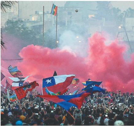
11月8日,示威人群聚集在智利首都圣地亚哥市中心。公交系统票价上涨在智利引发了持续社会动荡。

1月,委内瑞拉议会主席瓜伊多宣布自任“临时总统”,美国加大插手力度,委紧张局势加剧。9月,秘鲁总统比斯卡拉解散国会,府院之争白热化。10月,厄瓜多尔、智利发生暴力示威,厄政府机关被迫撤离首都,智利放弃主办亚太经合组织领导人非正式会议。10月底,玻利维亚出现动荡,深陷选举风波的总统莫拉莱斯辞职。11月,哥伦比亚爆发全国总罢工。此起彼伏的政治社会动荡反映拉美多国呈现政治斗争激化趋势,治理难题凸显。