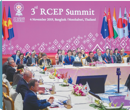
11月4日,第三次区域全面经济伙伴关系协定(RCEP)领导人会议在泰国曼谷举行。

11月4日,在曼谷举行的第三次区域全面经济伙伴关系协定(RCEP)领导人会议宣布,15个成员国结束全部文本谈判及实质上所有市场准入谈判。这标志着世界上人口最多、成员结构最多元、发展潜力最大的东亚自贸区建设取得重大突破。RCEP由东盟10国发起,邀请中国、日本、韩国、澳大利亚、新西兰、印度参加。印度暂未加入协定。尽管保护主义和单边主义逆流而动,这一突破凸显多边主义与自由贸易仍是世界主流。