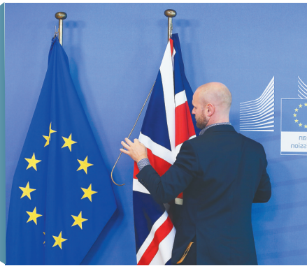
10月17日,在比利时布鲁塞尔的欧盟总部,工作人员整理英国和欧盟的旗帜,为欧盟委员会主席容克与英国首相约翰逊的关键性会面做准备。

10月28日,欧盟同意将英国“脱欧”日期推迟至明年1月31日。这是“脱欧”期限第三次后延。此前,“脱欧”协议屡遭英国议会否决,首相特雷莎·梅辞职。继任者约翰逊为打破“脱欧”僵局,推动英国12月12日提前举行议会选举。约翰逊带领保守党在选举中赢得下院绝对多数,“脱欧”前景趋于明朗。“脱欧”一拖再拖尽显英国社会严重撕裂、政治决策程序复杂低效,西式民主陷入体制困境和治理危机。