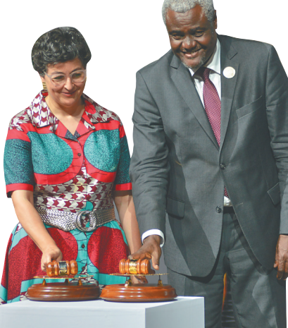
7月7日,在尼日尔首都尼亚美,非盟委员会主席法基(右)宣布正式启动非洲大陆自贸区建设。

7月7日,非盟特别峰会宣布正式启动非洲大陆自贸区建设,以消除贸易壁垒,实现各要素在非洲的自由流动,最终形成覆盖12亿人口、国内生产总值合计2.5万亿美元的统一大市场。非盟55个成员中的54个签署自贸区协议。这是非洲一体化进程的重要里程碑,有助于非洲解决市场碎片化的结构性问题,释放经济发展潜力,充分体现非洲国家联合自强的意愿和决心,对非洲经济社会发展具有深远意义。