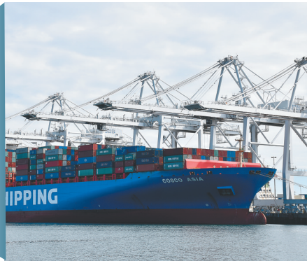
2月27日,中国货轮停靠在美国加利福尼亚州长滩港。

12月13日,中方宣布,经过中美两国经贸团队的共同努力,双方在平等和相互尊重原则的基础上,已就中美第一阶段经贸协议文本达成一致。一年来,中美经贸磋商经历曲折。6月,中美两国元首在大阪会晤,一致同意在平等和相互尊重基础上重启经贸磋商。此后双方经贸团队落实两国元首共识持续磋商,妥善解决彼此核心关切。中美达成这样的协议有利于中美两国和世界,将在经贸、投资、金融市场等方面产生积极效应。