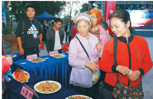
1月4日,屯昌电音美食嘉年华活动展出的当地特色美食备受关注。

与枫木苦瓜相邻的是屯昌香草鸭展台。据介绍,香草鸭在饲养过程中主要以玉米为主,辅以山沟小溪螺、小虾、蚯蚓虫以及水边野草进行喂养,均属绿色无公害食物,在饲养过程中完全实现“零饲料”饲养。得益于种苗独特、养殖方法规范,屯昌香草鸭肉质具有野禽风味,胸腿肌占比达到27%至30%,相比于其他肉鸭具有肉质好、瘦肉率高、料肉比低,抗病力强等特点。