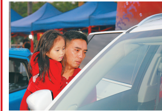
1月4日,屯昌群众在活动现场选购汽车。