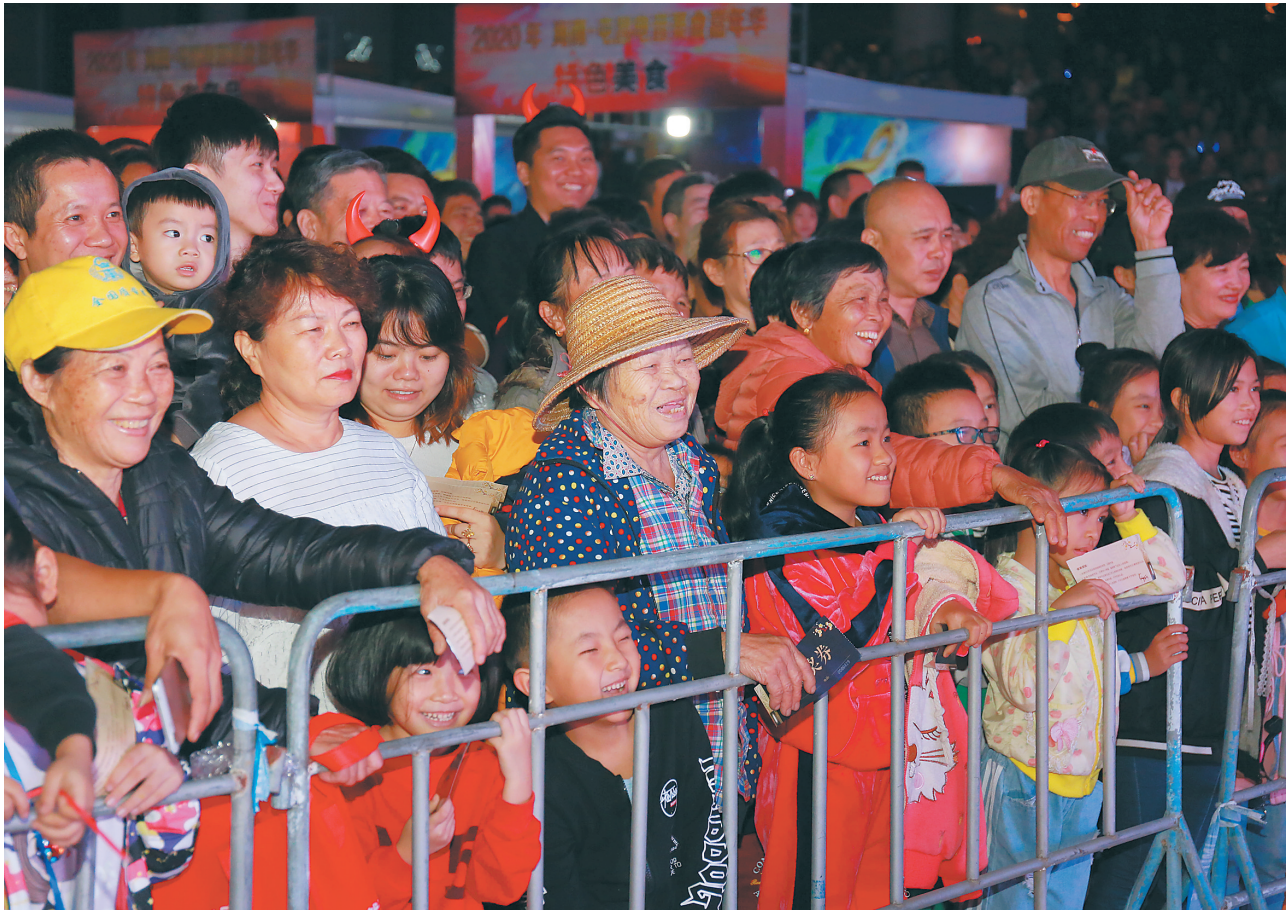
1月4日,屯昌电音美食嘉年华活动在县体育馆前举行,群众热情参与。