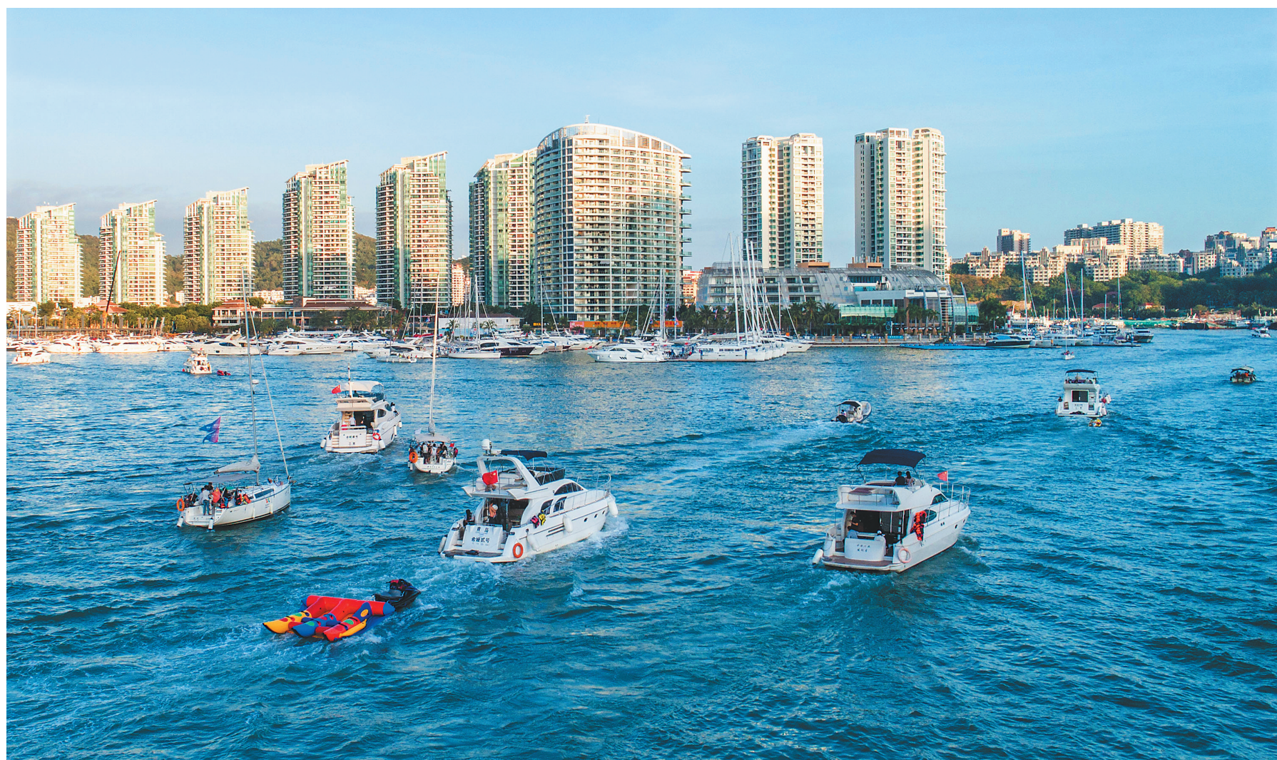
2020年1月7日傍晚,游艇载着游客返回三亚鸿洲游艇码头。

据悉,2019年6月至11月,全省新增游艇俱乐部6家,同比增长50%;注册登记游艇95艘,同比增长33%。