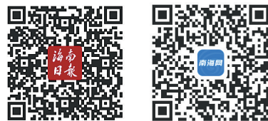
更多精彩观点请扫码

有网友认为,家里“有矿”就可以任性,家长自己的钱爱干啥干啥,对此现象没必要说三道四。但是,这不是家里有没有钱,请不清得起保姆的问题,而是如何让孩子增强生活自理能力和独立成长的现实问题,家长如果能厘清其中的利害关系,相信大都不会选择亲手将自己的孩子培养成巨婴。走出襁褓,无法成为一个人格健全、独立自主的成年人,其未来的人生道路,很难经得起风浪和波折。而家长不可能为孩子“一手包办”一辈子。因此,广大家长可以疼爱孩子,但千万不能溺爱,在注重孩子学习之外,应当适当给孩子补一补劳动教育课,让孩子干一些力所能及的家务活,培养其生活自理能力和良好生活习惯。(红网)