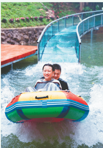
游客在体验高空漂流。