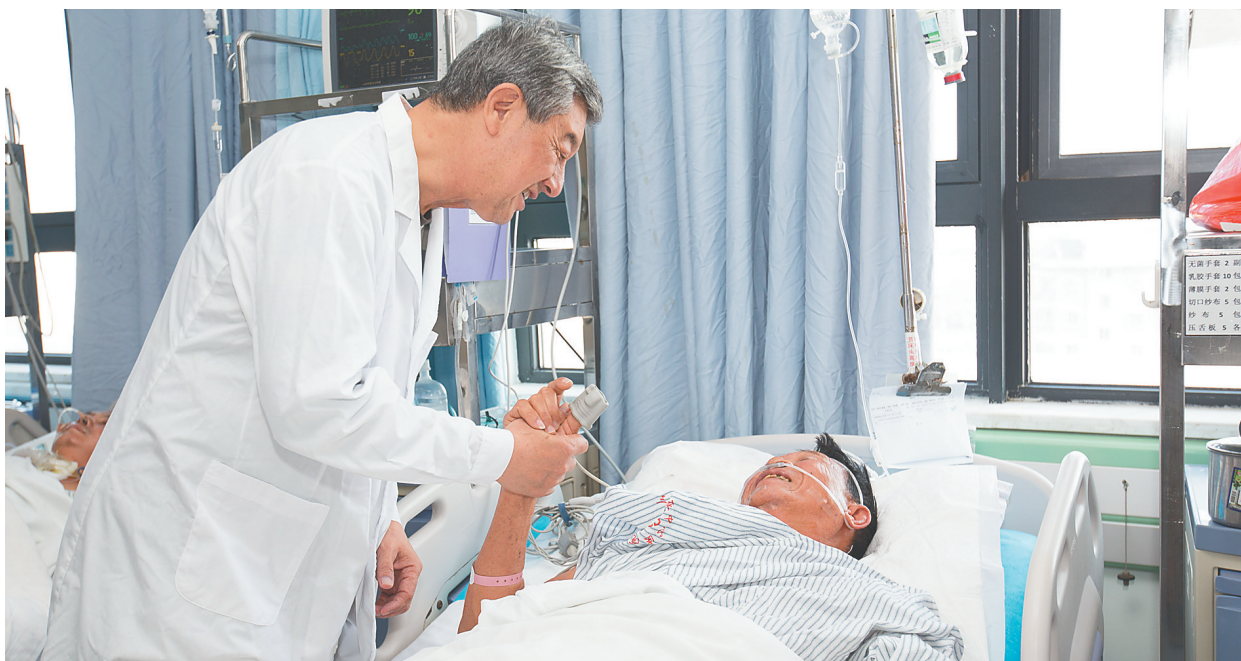
北京大学第一医院原神经外科主任医师、教授鲍圣德在三亚中心医院病房查看病患病情。

曾在吉林大学第二医院工作了44年的韩喜春与海南结缘,是因为“京医老专家百人团”智力帮扶海南项目。