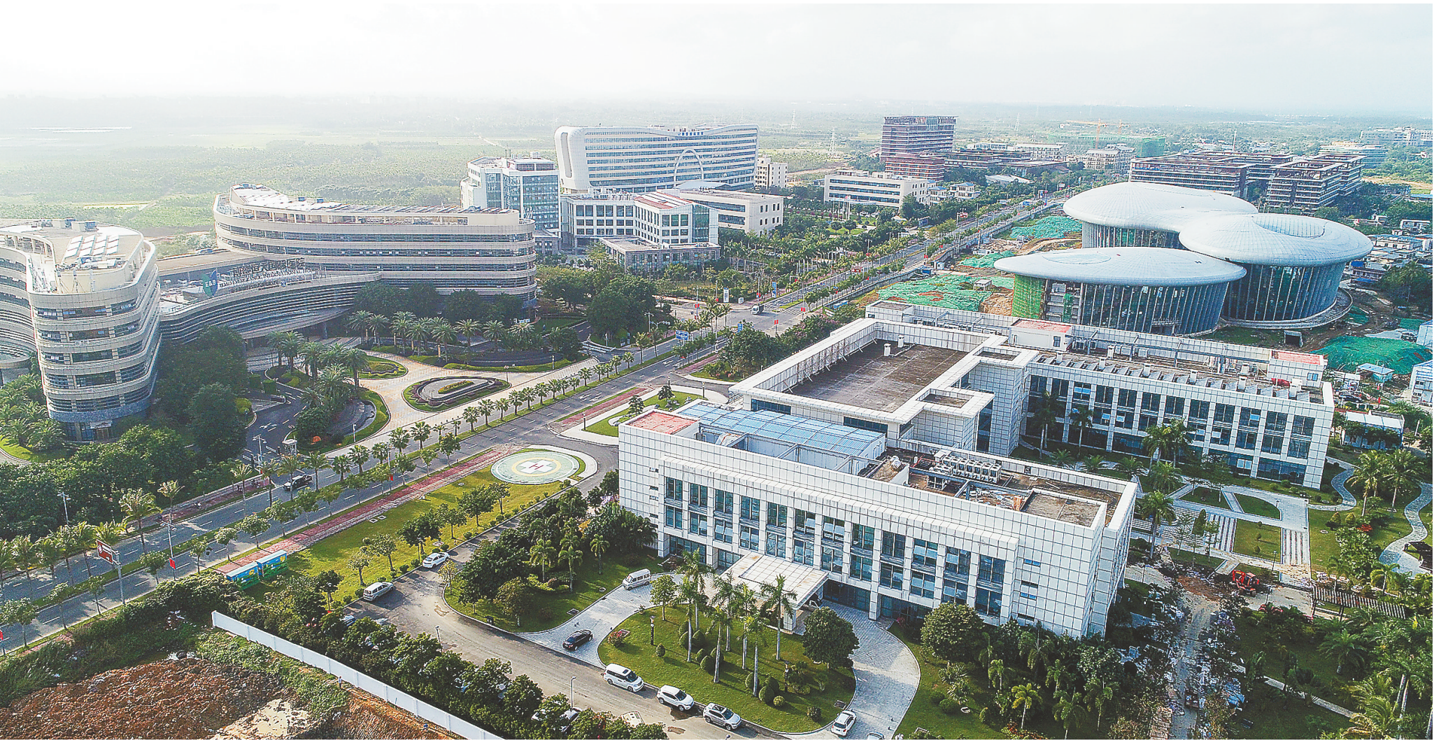
《关于支持建设博鳌乐城国际医疗旅游先行区的实施方案》的出台，为先行区建设发展增添了新动力。图为1月6日，高空俯瞰博鳌乐城国际医疗旅游先行区。