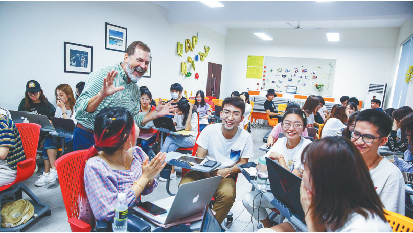
2019年10月9日，海南大学亚利桑那州立大学联合国际旅游学院学生在上课。作为海南首个中外合作办学机构，该学院对外引智成效显著。