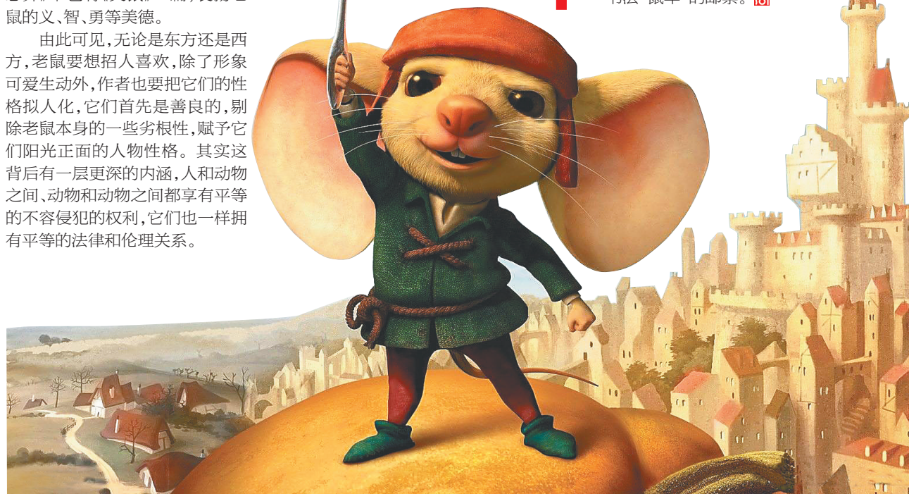
《浪漫鼠德斯佩罗》中的小老鼠德斯佩罗。