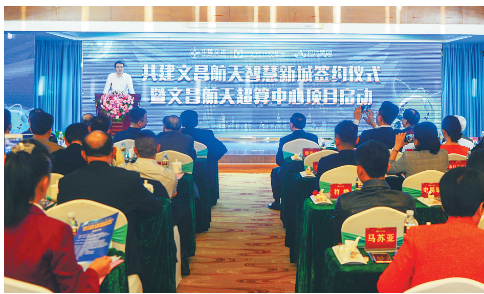
共建文昌航天智慧新城签约暨文昌航天超算中心项目启动仪式现场。

携手发挥各自在网络空间技术应用、5G通信技术、超算中心、智慧城市及其产业发展中资源、技术、资本互补的优势，整合央企集团以及中关村地区数万家企业、高等院校、科研院所所在数字科技与移动通信相融合的前沿成果转化，推进海南文昌国际航天城建设。