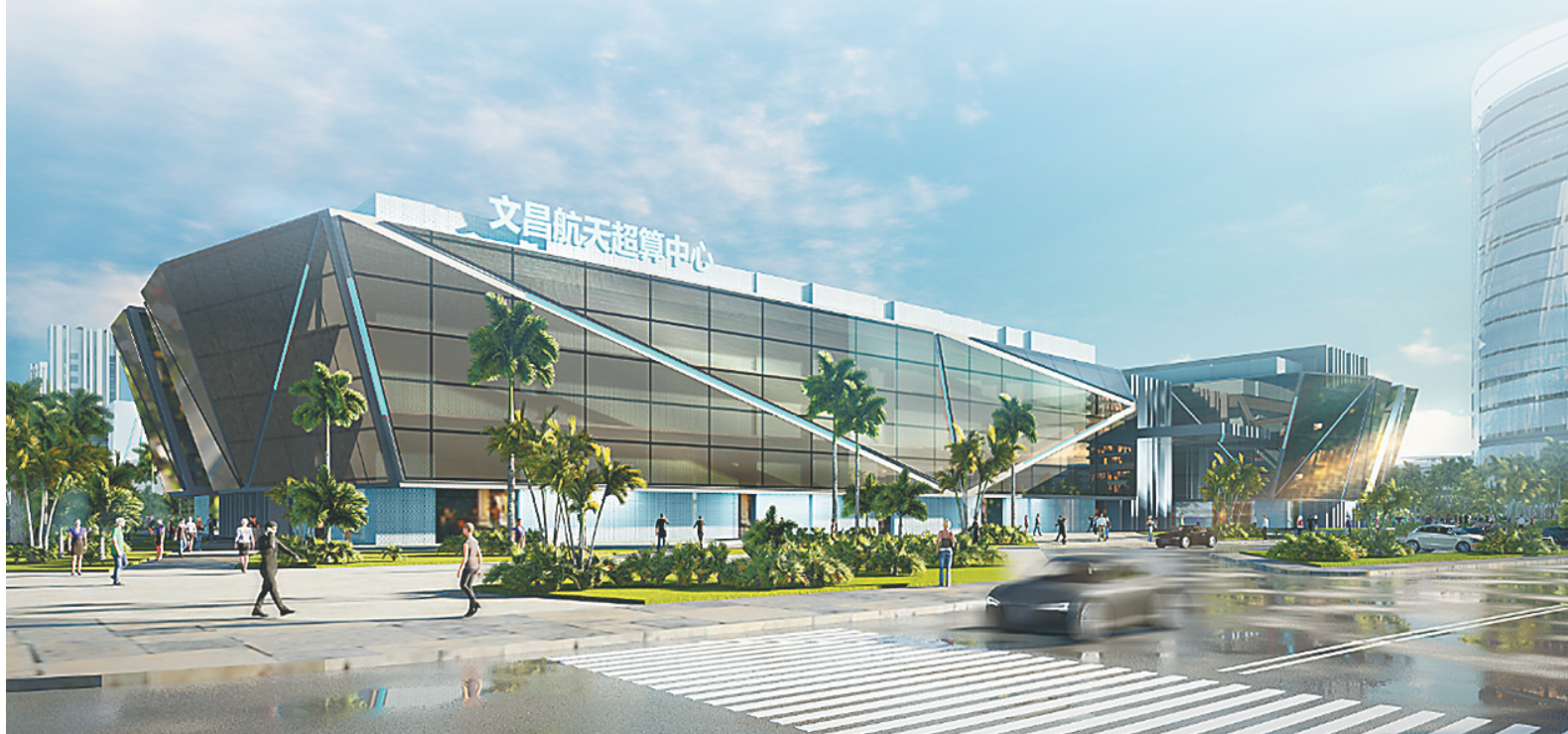
文昌航天超算中心效果图