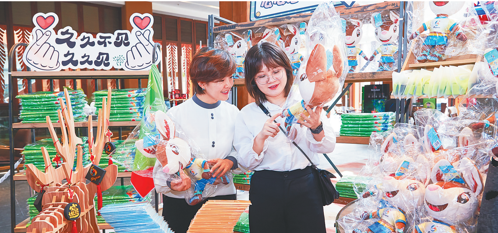
游客在亚沙会特许商品专营店，选购吉祥物“亚亚”毛绒公仔。

本报三亚1月22日电（记者欧英才 徐慧玲）1月22日上午，2020年第六届亚洲沙滩运动会（以下简称亚沙会）高级合作伙伴（银行类）暨政银金融服务合作签约仪式在三亚举行，中国工商银行正式成为2020年亚沙会高级合作伙伴。这也是亚沙会市场招商工作中确定的首个高级合作伙伴。 签约仪式上，亚沙会组委会副秘书长、三亚市副市长周俊代表亚沙会组委会与工行三亚分行行长王玲签订《2020年第六届亚洲沙滩运动会高级合作伙伴（银行类）协议》，并向工行三亚分行授予高级合作伙伴牌匾；三亚市副市长吴海峰代表三亚市政府与工行海南省分行副行长李峰签订《金融服务合作协议》，并向工行海南省分行授予金融服务战略合作银行牌匾。 根据双方约定，工商银行将全力支持亚沙会组委会工作，提供高质量的金融服务，积极做好亚沙金融保障，助力三亚“办好一次会，搞活一座城”，促进双方共谋发展、实现双赢。 周俊表示，此次签约标志着工行与亚沙会组委会共同开启了“共享共赢、共筑亚沙”的新篇章。工行将有机会参与实现与三亚“体育+”产业深度融合，抢占金融服务助力海南自贸港建设的市场先机，进一步提升企业形象，扩大企业品牌影响力。 工行海南省分行副行长张波表示，工行海南省分行将积极参与亚沙会的筹办工作，为亚沙会的成功举办提供全方位、高效便捷的金融服务，并以此为契机，进一步深化与三亚市委市政府的合作交流。