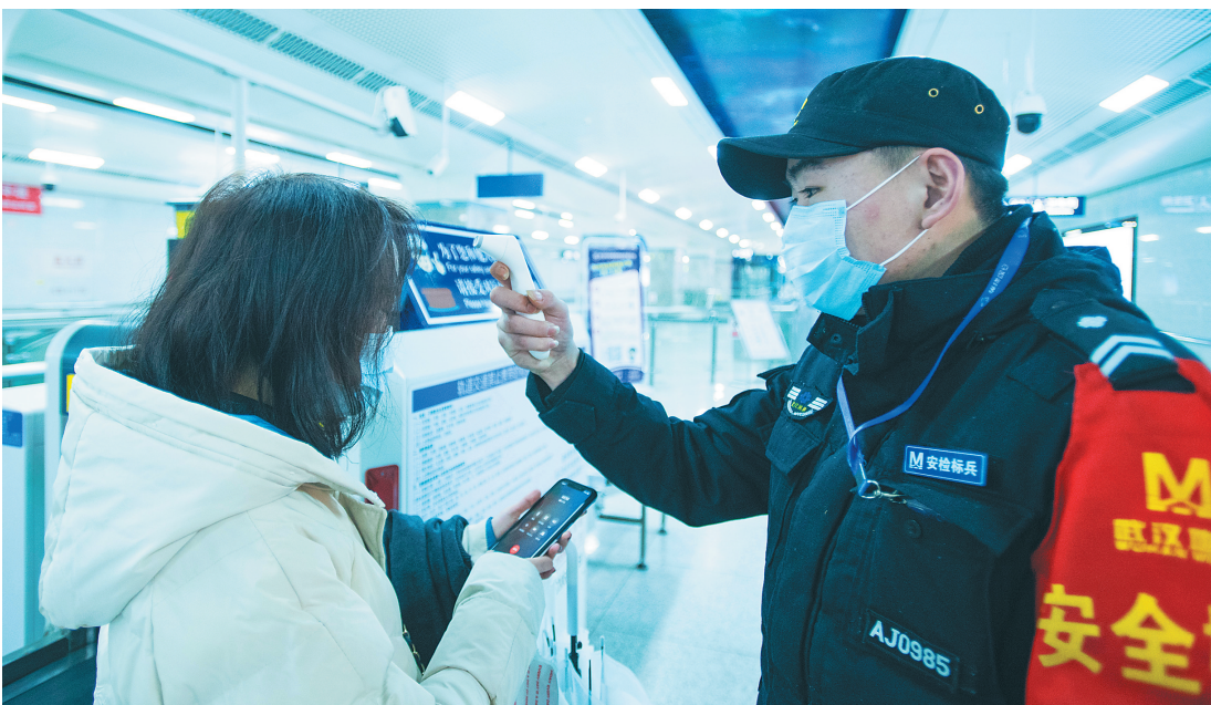
一月二十三日，在武汉地铁八号线汪家墩站，工作人员对旅客进行体温检测。

针对网传武汉加油站停止供油，武汉市商务局随后发布通知，称武汉市成品油经营企业充足，供应正常。油企启动应急预案，确保加油站24小时营业，不断档、不脱销。