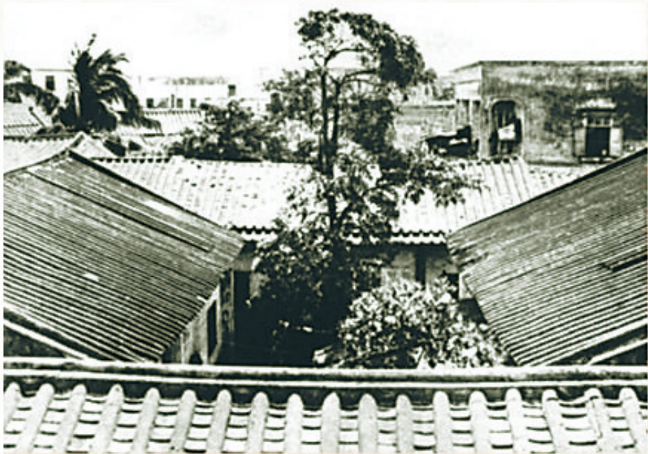
中共琼崖一大旧址老照片。

中国人民解放军40军118师352团加强营从雷州半岛 鹅房港启航，潜渡琼州海峡，进军海南岛。