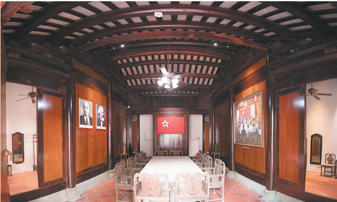
中共琼崖一大旧址展馆。