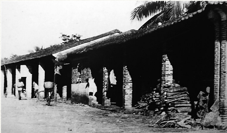
1927年9月23日，椰子寨战斗打响全琼武装总暴动第一枪。图为椰子寨战斗遗址。(资料图片)

在椰子寨战斗历史陈列馆广场上，由一面旗帜和一杆长枪组合造型、总高度为9.23米的主题雕塑矗立着。“旗帜寓意椰子寨战斗竖起的琼崖革命武装斗争‘二十三年红旗不倒’，枪杆子寓意全琼武装总暴动从椰子寨战斗开始打响，雕塑的高度