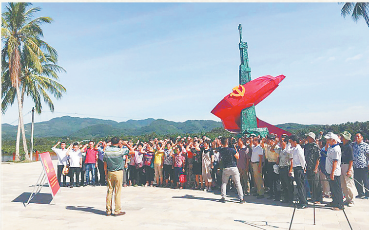
琼海部分党员在琼海椰子寨战斗主题雕塑下，面对党旗庄严宣誓，重温入党誓词。