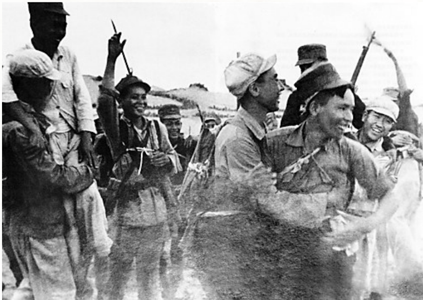
解放军登陆部队在海南岛北部海岸与琼纵接应部队胜利会师。(资料图片)

在野战军两个加强营胜利登陆不久，40军352团的两个排在雷州半岛海面上执行任务时，被海风和潮流漂过琼州海峡，他们便果断地登陆，得到儋县一区党政组织和民兵的及时接应，共同打退了国民党军1个营的进攻，安全进入解放区。