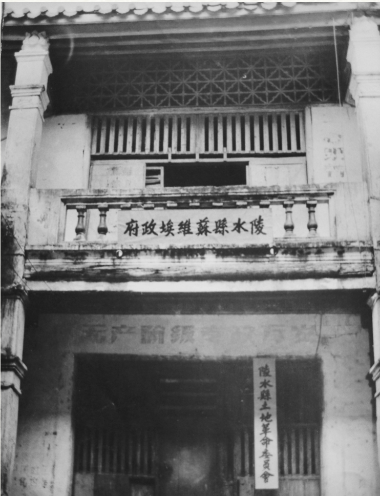
陵水县苏维埃政府旧址。