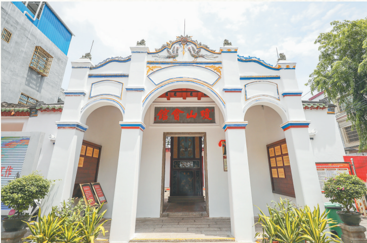
陵水县苏维埃政府旧址琼山会馆现在是爱国主义教育基地。

“1927年5月24日，反动民团300多人向坡村进发，坡村军民凭借山区的有利地势迎击敌人，经过一个多小时的激战，歼敌数十人，活捉十余人。”望着旧址内展出的老照片，陈筱映介