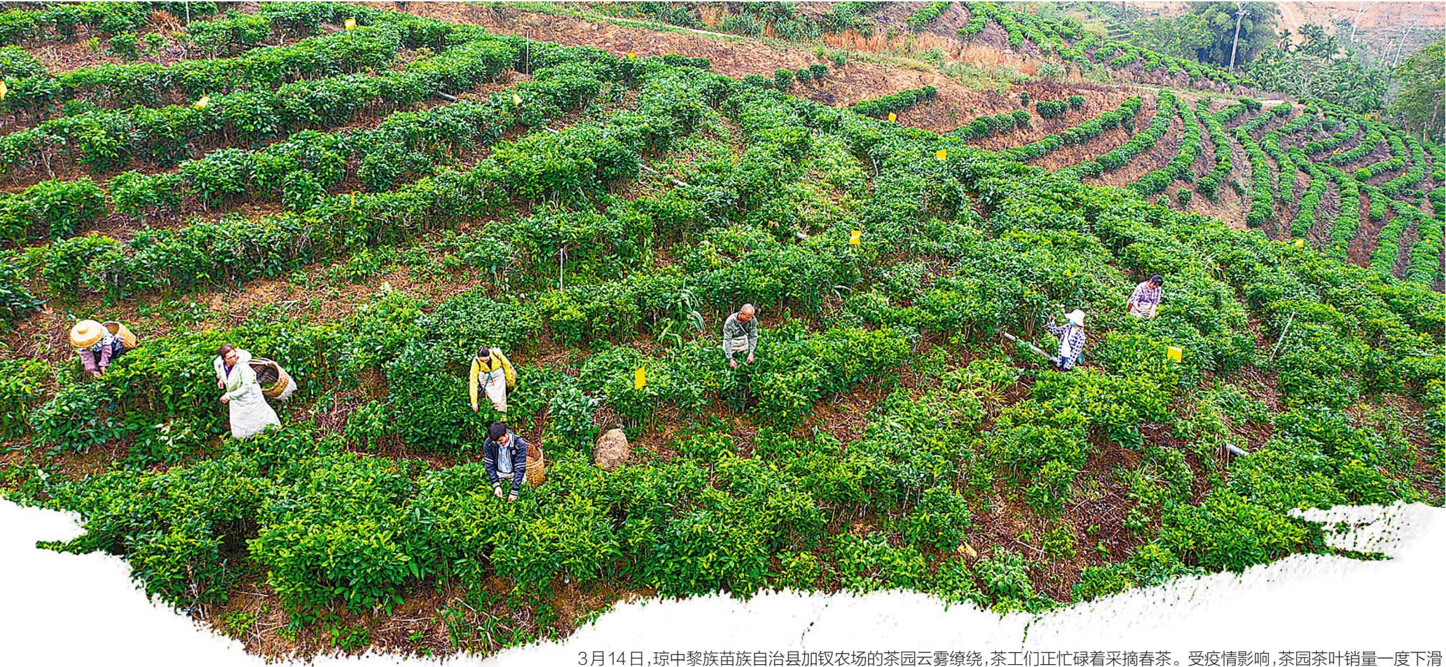
3月14日，琼中黎族苗族自治县加钗农场的茶园云雾缭绕，茶工们正忙碌着采摘春茶。受疫情影响，茶园茶叶销量一度下滑，为保障近百名茶工的收益，加钗农场仍正常收购春茶加工生产。随着气温升高，茶园将在夏季雨水的滋润下迎来丰产。