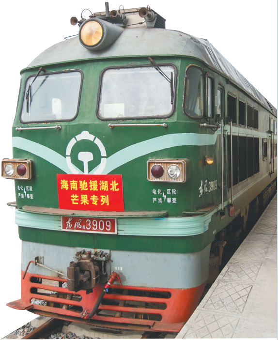
近日，42402次列车驶出三亚市天涯站，装载着132吨芒果前往湖北省荆州市沙市站，驰援湖北抗疫。这批芒果由三亚农业投资集团有限公司联合爱心单位捐赠，共计26400箱。