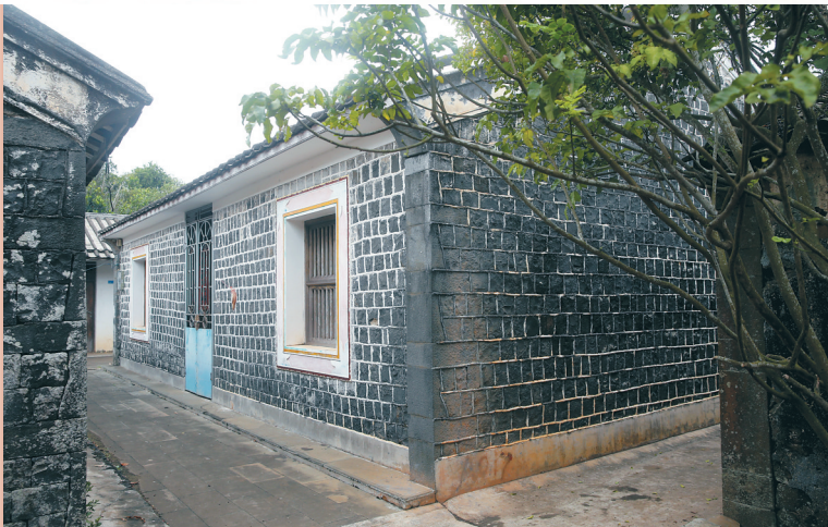
坐落在海口市演丰镇昌城村的徐成章烈士旧居(房屋已翻新)。