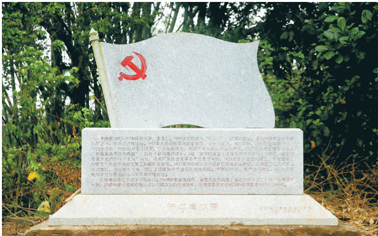
位于海口市演丰镇昌城村的徐成章烈士石碑。

古屋久无人居,里头依然干净整洁,墙上挂着一张1983年由民政部颁发的革命烈士证明书。证书背后,是徐成章立下的丰功伟绩。