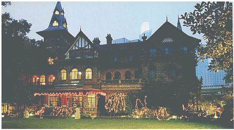
马勒故居。

梅兰芳故居中心院落内最引人注目的是两棵柿子树。夏天，家庭成员和客人通常会把桌椅从周围房内搬到院中，抄手游廊把庭院分成几个自然的空间，但分而不隔，虚虚实实，对外只有一个街门，关起门来是封闭式的住宅，自成天地，家庭成员在这里享受美好的阳光与