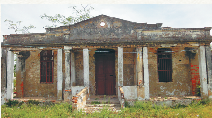
琼西中学校史馆的前身，称“四合院”，建于抗战时期，图片于2010年拍摄。

生、林杨春、郭日明等人在抗日战争和解放战争中英勇牺牲；史丹、马白山、钟岳、吴爱民、周珠江、吴以怀、陈光武、黄涌、赵登亨、文宝庆、吉寒冬、羊礼等30多人，则先后成为中国共产党各级党政军领导干部。