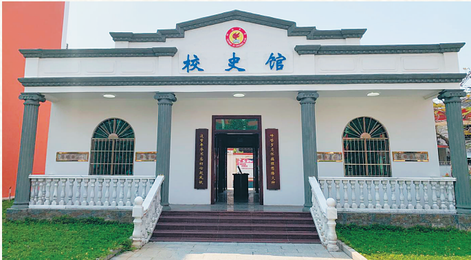
如今的琼西中学校史馆。本报记者 张文君 摄

学校停办后，250多名师生大部分投笔从戎，奔赴前线，参加中国共产党领导的琼崖抗日独立队。后来，赵之翼、文定魁、王廷俊、吴孔章、吴家成、陈斗平、林德安、林