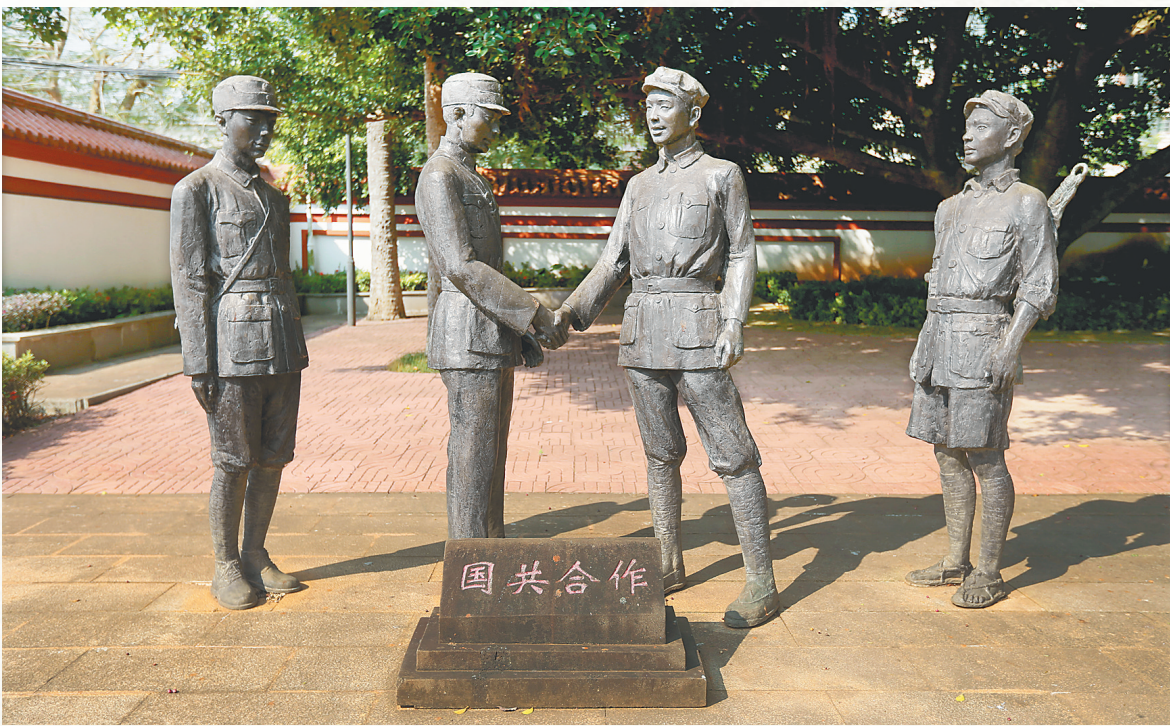
坐落在海口市云龙镇的琼崖红军云龙改编旧址内，一座名为“国共合作”的雕塑。

14年后，破旧的“六月婆”庙上建起了琼崖红军云龙改编旧址（以下简称云龙改编旧址）。几十年间，后人们从各地纷至沓来，缅怀革命英雄，继承先烈遗志，努力完成历史赋予一代代人的光荣使命。