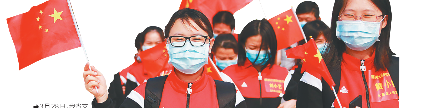
3月28日，我省支援湖北抗疫前方指挥部，第六、第七批支援湖北医疗队，乘机抵达海口美兰国际机场。