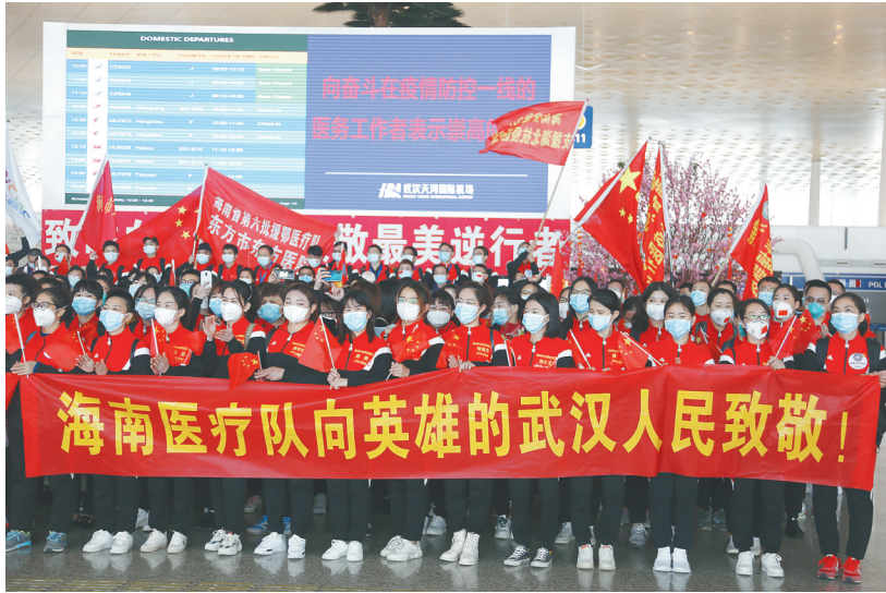
3月28日，湖北省武汉市，海南支援湖北358名队员出发横城致敬武汉人民。

“回武汉、回荆州看看”也成为众多援鄂医疗队队员心里种下的愿望。（本报海口3月28日讯）