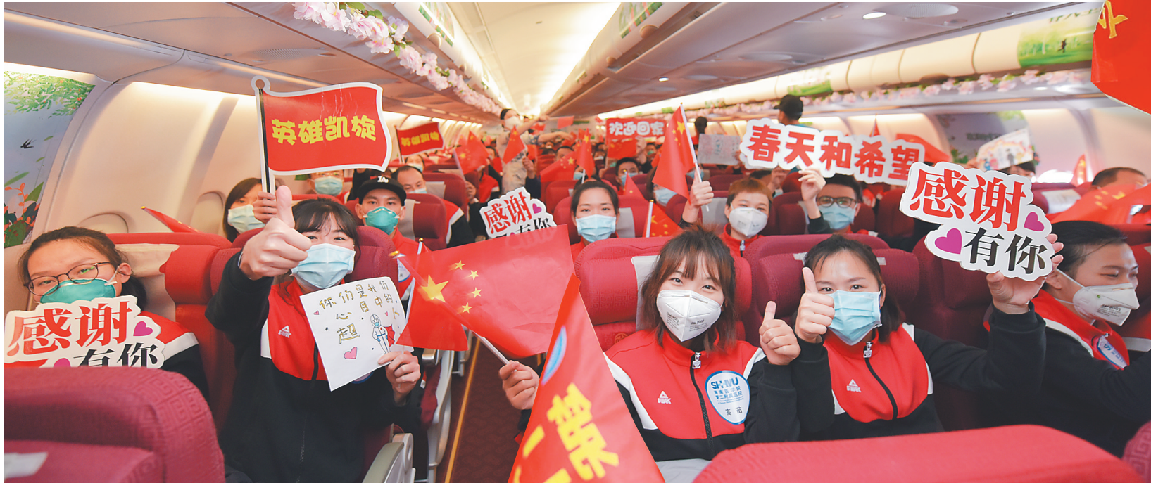
3月28日，从武汉飞往海口的航班上，海南驰援湖北医疗队员一起歌唱祖国。