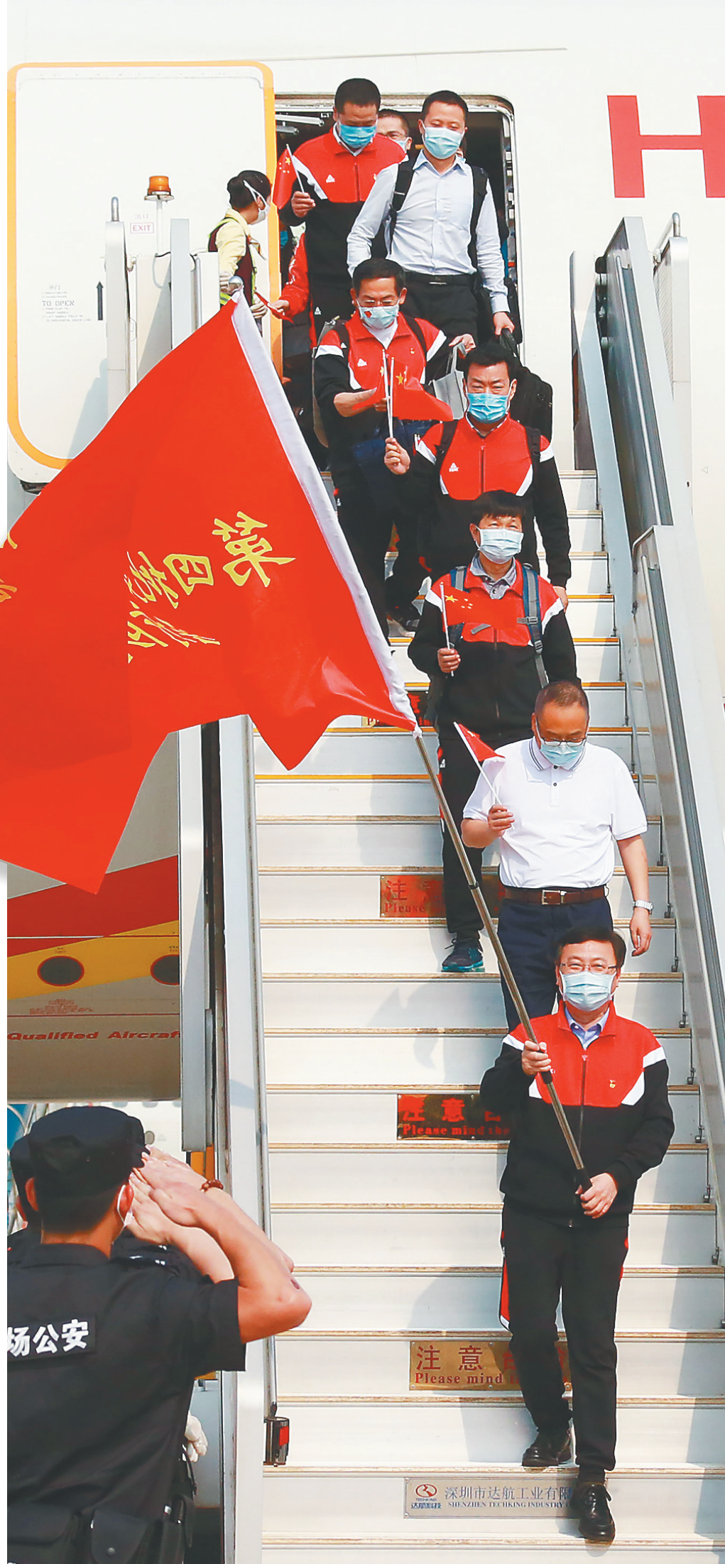
3月28日，我省支援湖北抗疫前方指挥部，第六、第七批支援湖北医疗队成员缓缓走下舷梯。