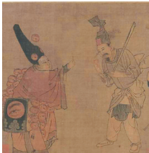
无名氏《杂剧眼药酸图》(局部,宋)