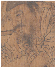
李嵩《货郎图》(局部,宋)