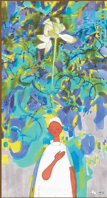
黄永玉作品《我的祖国·我的人民》