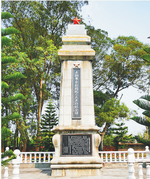
位于儋州西流居的木排革命根据地人民英雄纪念碑，于一九八九年十月落成，二〇一五年进行修缮。