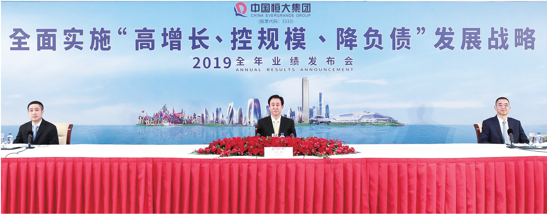
许家印宣布恒大全面实施新战略

造成资金沉淀和推高负债。 20余年的发展和积累,使恒大成为全行业土储最高的房企之一,截至2019年末,恒大拥有2.93亿平米的土地储备,只要适度减少拿地,充分利用现有土地储备,便能确保公司的持续发展,无须再大举消耗资金拿地。 据恒大管理层介绍,今年公司总可售面积达1.32亿平方米,可售货值达1.27万亿,按照64%的去化率保守估算,可实现销售8110亿,完成8000亿销售并无压力。