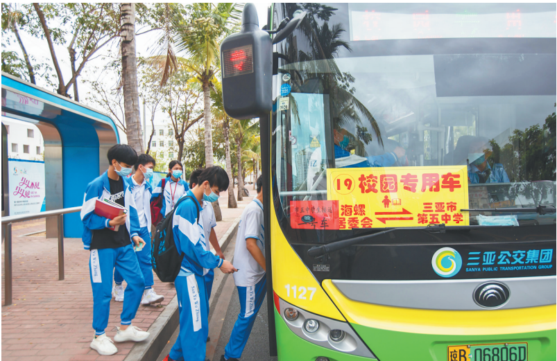
4月7日，三亚市第五中学学生正搭乘校园专用车上学，该市共投放100辆“校园专用车”点对点接送师生，共覆盖43所学校。