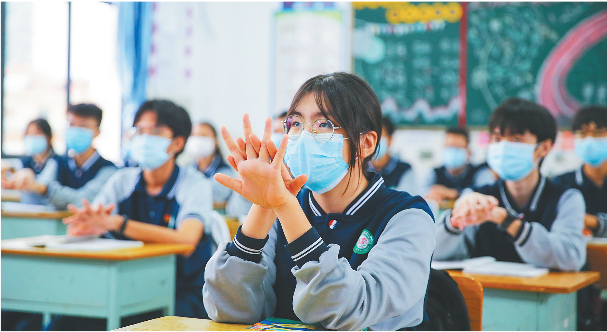
4月7日，在海口市玉沙实验学校，开学首日的初三年级学生在老师示范下做“七步洗手操”。