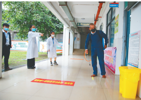
4月7日，在海口市玉沙实验学校，工作人员在专业人士指导下开展校园消杀。