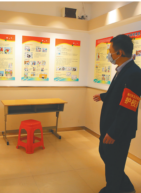
4月7日，开学首日的海口市玉沙实验学校工作人员检查隔离室。

本报嘉积4月7日电(记者刘梦晓 通讯员王子越)4月7日上午，是我省高三、初三学生2020年春季学期开学日，琼海供电局嘉积、中原供电所党团员服务队分别对该市嘉积中学、华侨中学的供电线路、计量装置、开关设备等开展全方位“体检”，重点排查学校配电房、教学楼、食堂以及宿舍等区域供电设备安全隐患，协助校方维护整改。 教室之外，食堂是用电设备较为集中的地方。供电部门对各学校食堂内的大功率厨房设备、消毒柜、紫外线消毒灯等用电设施进行专项检查，确保满足疫情防控需要。同时加强电网运行监控，开辟绿色通道优先办理校园用电业务，保障学子备战中、高考。 琼海供电局市场营销部有关负责人说，为确保学校的用电供电可靠和用电安全，琼海供电局按照“一校一册一方案”的原则，对学校的供电线路进行全方位的用电检查并协助学校整改，维护到位，为学校的开学用电保驾护航。 据了解，琼海供电局还与全市各学校建立沟通联动与应急协调机制，提前做好应急发电机检查、油料准备及接入方案相关辅助性工作，全力保障新学期学校用电需求。