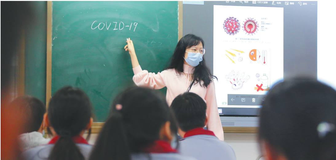
4月7日，海口市第八中学的英语老师教给学生新学期的第一个单词——COVID-19(新型冠状病毒肺炎)。