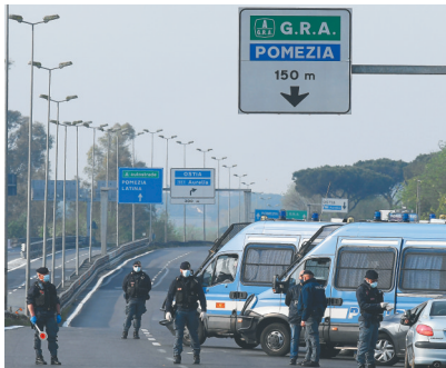
意大利新冠死亡病例超三万 新华社发

针对最新情况，欧洲各国采取了不同策略。 一方面，继续延长隔离措施：意大利总理孔特上周宣布，将“封城”措施从原定4月13日结束继续延长。法国总统马克龙13日晚发表电视讲话说，为遏制新冠疫情而采取的“禁足令”将延长至5月11日。代表首相约翰逊处理有关事务的英国外交大臣拉布表示，英国政府预计不会在这周调整“社交距离”等防疫措施。 另一方面，各国也采取了部分“松绑”的策略。比如，法国幼儿园和中小学在5月11日之后将视情况陆续恢复开学，但是高校开学日将推迟至9月，此外易感染体弱势群体仍将需要遵守限制措施。 (据新华社北京4月14日电)