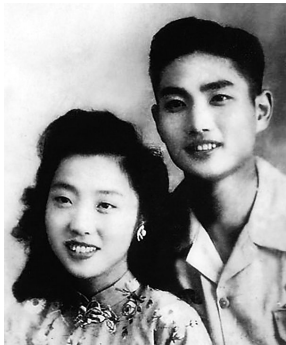
平如与美棠的照片

无力抵挡思念,一笔笔画下、写下他俩的故事。他将她的骨灰放在床头,要她等他一起入土。在他的讲述下,他俩的故事一次次让读者落泪,让观众动容。