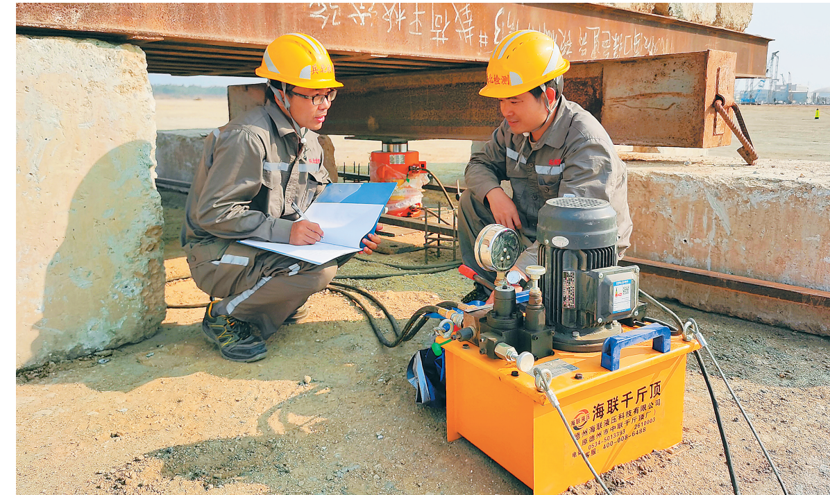
洋浦100万吨乙烯项目复工后,以超常规举措推进项目建设。图为4月21日,施工人员正在开展静载试压工作。

河北兵北工程检测公司还负责地基贯入试验,即用地质勘探机往地下钻孔10米取样,检查地基处理密实程度,是否达到施工设计要求。“我们用8台勘探机同时作业,每天提前1个小时上班。”钻探组组长李玉严