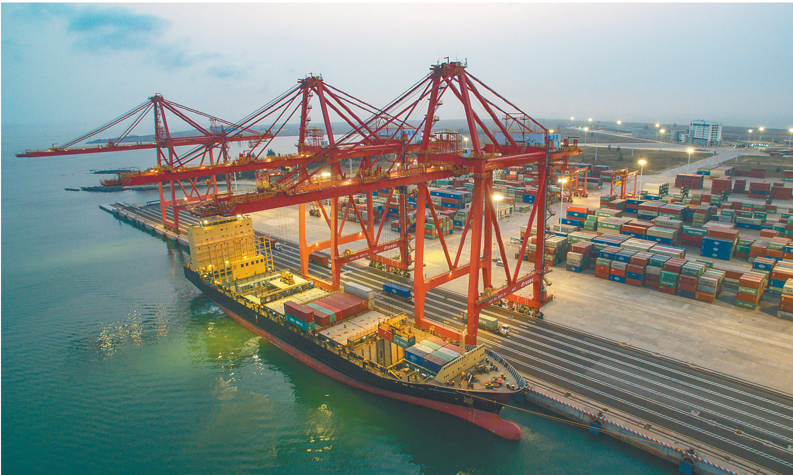
洋浦：“巨龙”展臂运输忙

统计数字显示，3月，海运货运同比激增1.81倍，其中海运进口增长63.88%、海运出口增长5.8倍；出境旅行形成2.46亿元外汇支出，同比增长20.41%，教育旅行和私人旅行各占半壁江山。