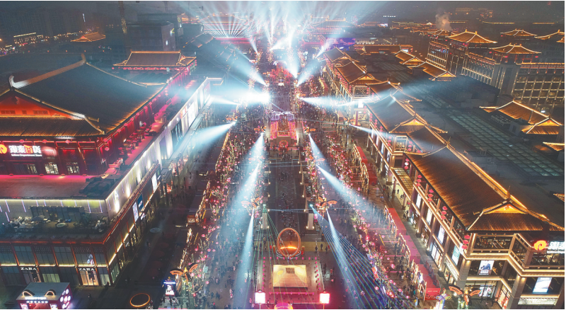
西安大唐不夜城夜景(2019年2月17日无人机照片)。

大唐不夜城步行街位于西安市大雁塔脚下，近年来，步行街突出历史文化特色，以唐代元素为主线，创新打造文化浓厚的现代时尚街区，已成为西安旅游新地标。