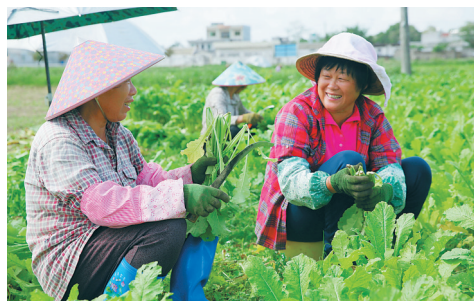
澄迈县金江镇夏富村大茂村民小组村民在酸菜基地摘菜。