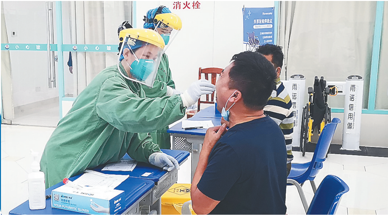
海南省人民医院门诊护士为就诊者进行咽拭子采样。

海南日报记者从省内多家医院了解到,原本受疫情影响的门诊量逐渐回升,积压的就医需求正在释放。为严格落实“外防输入,内防反弹”防疫工作新要求,我省各大医疗机构结合实际情况,对住院患者新冠肺炎排查做出相关规定及调整,其中对住院患者以及陪护特别提出提供核酸检测证明的要求,并且减少或谢绝探视。