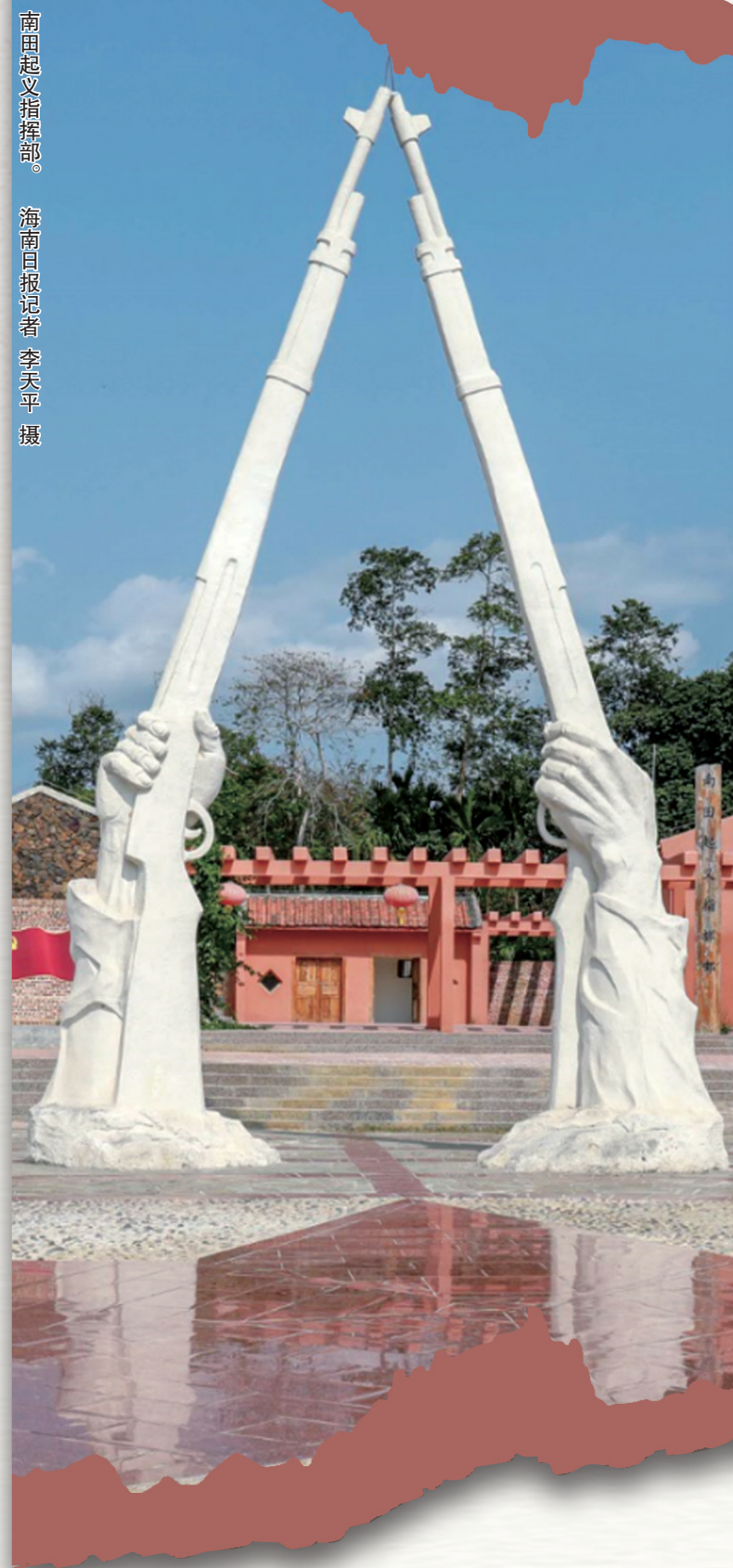
南田起义指挥部