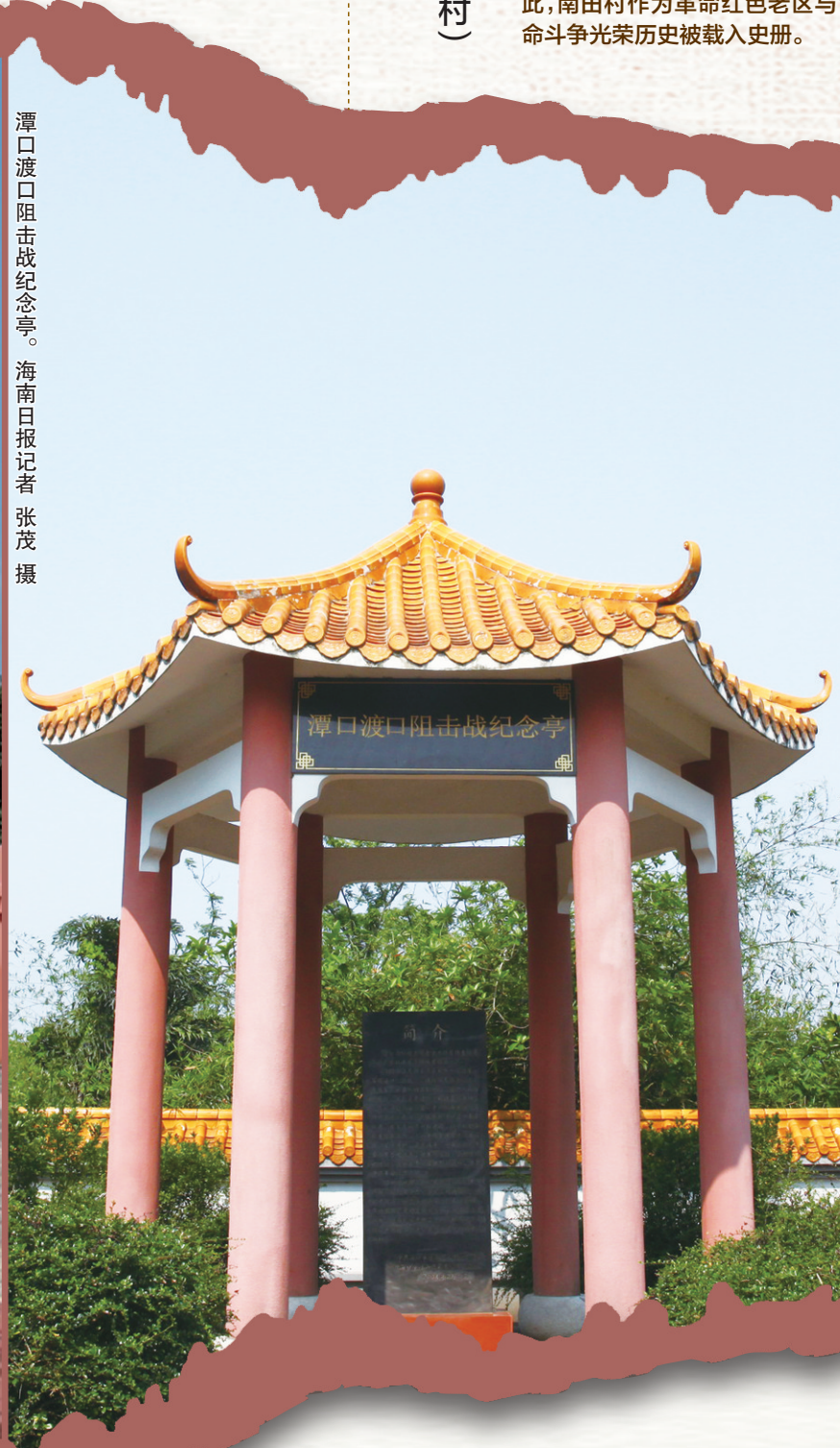
潭口渡口阻击战纪念亭