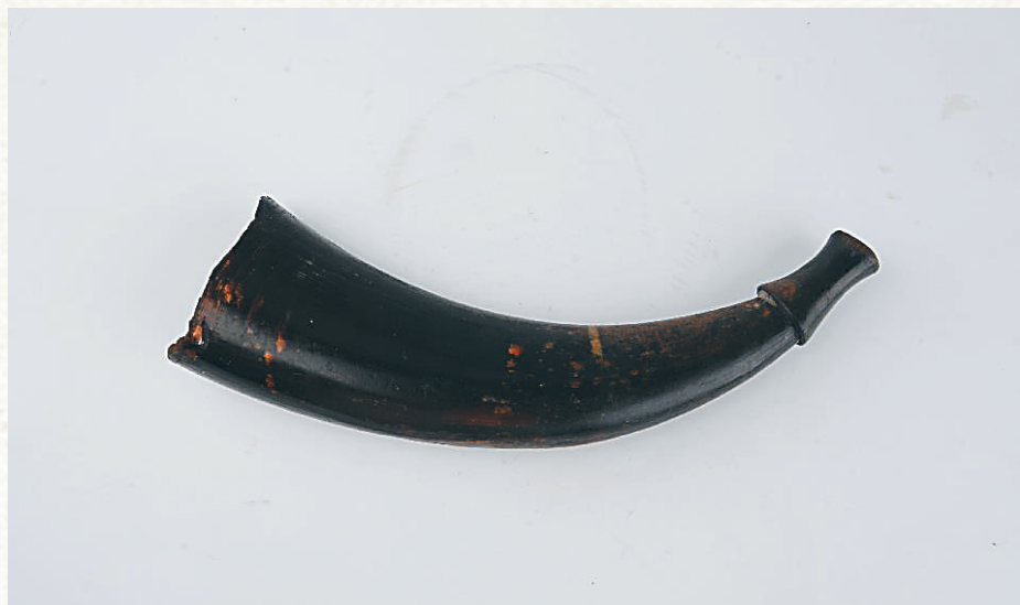
陵水苏维埃政府农军的牛角号。

其中有一件文物显得平平无奇,但又被放置在了展厅中的显眼位置,那是一个通体黝黑、被摩擦得发亮的牛角号,这样一件黎族同胞过去常用的吹管乐器,它在革命年代里曾经有过哪些故事呢?