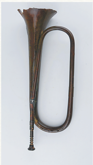
国民党丢弃的铜号。

牛角号是黎族重要的吹管乐器,陵水革命队伍中黎族同胞又占多数。当农民军被围困在坡村,条件较为艰苦,牛角号自然被选作革命队伍的军号,直至苏维埃建立及许多后续战役中,都可以看到牛角号的身影。(梁君穷)