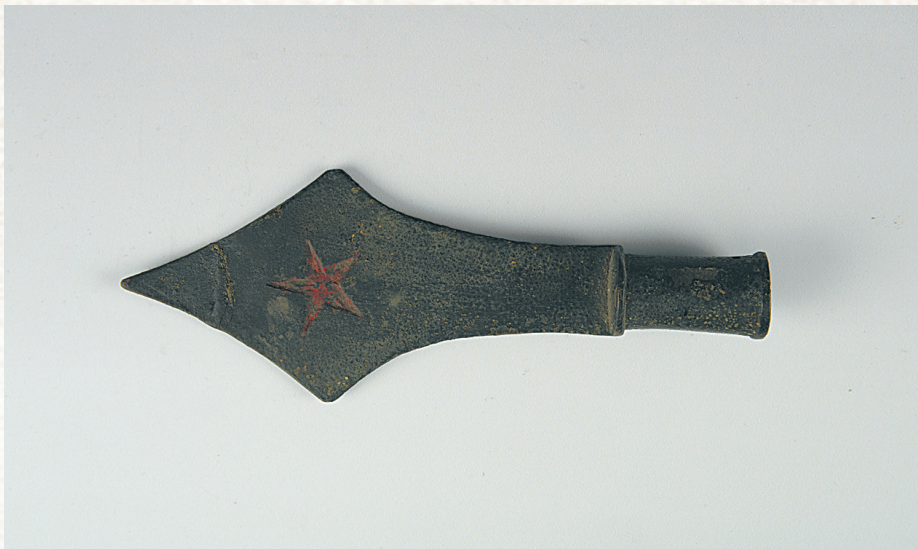
20世纪30年代琼崖工农红军标枪头。

为了实现海南岛的解放,琼崖人民武装在极其艰苦的条件下,尽力保证战斗武器的供给。省博物馆馆藏的20世纪30年代琼崖工农红军标枪头(用于长矛),曾见证了长矛这种普通的冷兵器,成为琼崖革命初期许多革命战士打击敌人,追求人民解放的重要武器。