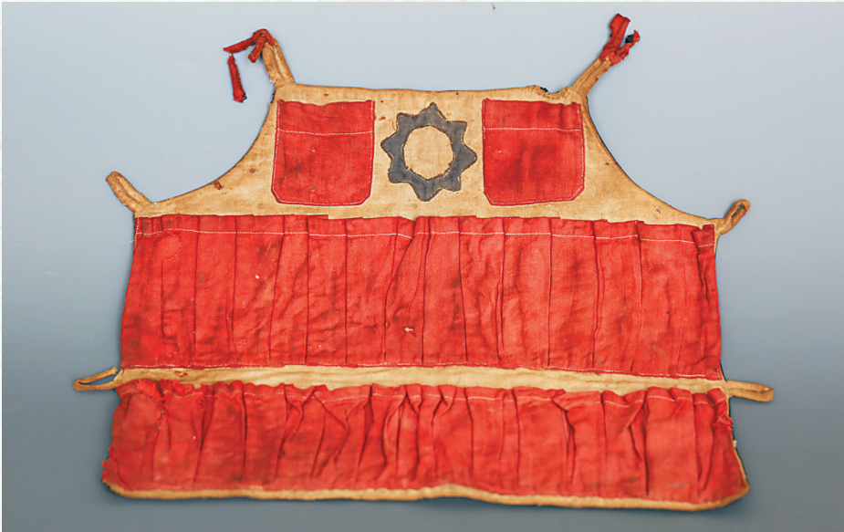
白沙民族博物馆收藏的琼崖革命战士用过的子弹袋。

白沙黎族自治县民族博物馆的革命文物展区，陈列着三件外形不一的民兵子弹袋，分别呈葫芦状、斧头状、防弹背心状。该馆的文物资料卡显示，这是一式三件”子弹袋，用棉纱纺织与缝制而成，为1984年4月从民间征集得来。据白沙民族博物馆馆长张文花介绍，在解放战争时期，白沙黎族、苗族民兵曾用过这些子弹袋放置子弹、火药。