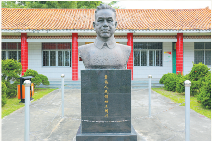
白沙起义纪念园内的王国兴雕像。

意中人。革命年代，粉枪作为老百姓家中主要的热兵器，是琼崖革命中群众武装发展壮大标志。