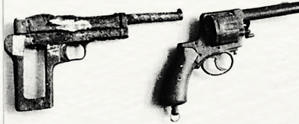
抗战时期琼崖抗日独立总队指挥员用过的手枪。 (资料图)