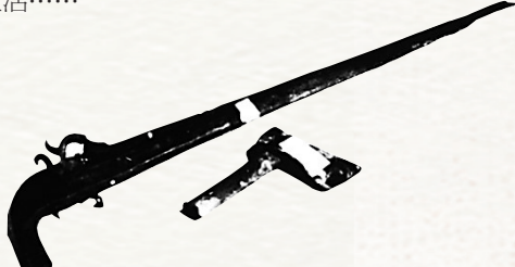
抗战时期琼崖民兵使用过的火药枪和斧头。 (资料图)