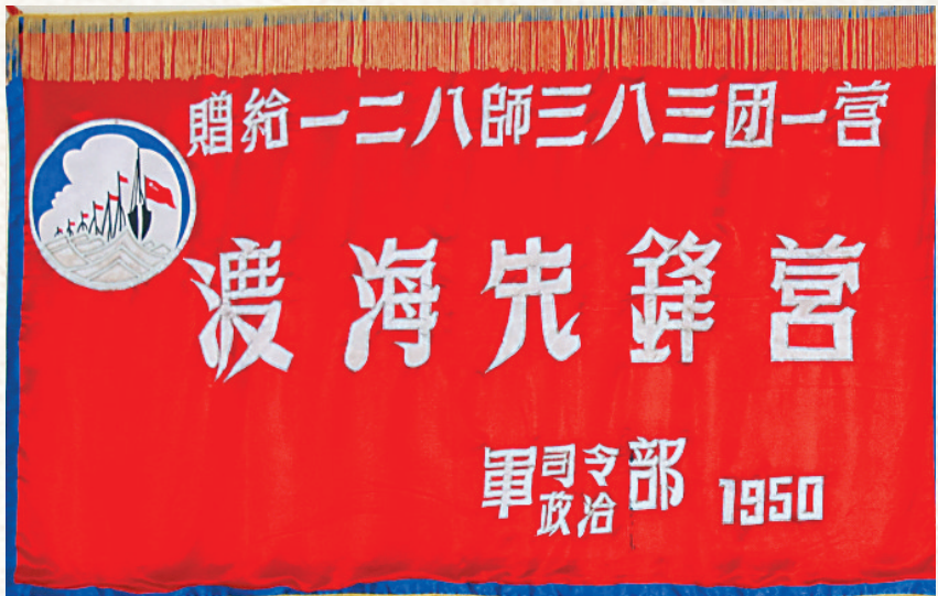
43军128师383团一营渡海先锋营锦旗，现藏于中国人民革命军事博物馆。（资料图）

一面长方形的旗帜，上部饰有金黄色的麦穗边，岁月的洗礼并未让它褪色多少。缎面材质、鲜红底色和锦旗上的流苏，依旧向人们展示着昔日的荣光。 这面锦旗如今被收藏在中国人民革命军事博物馆内。“赠给一二八师三八三团一营 军司令部、政治部 1950”，锦旗上的这些文字不禁让人想到当年渡海先锋营战士穿越炮火、跨越琼州海峡的必胜决心和不辱使命。