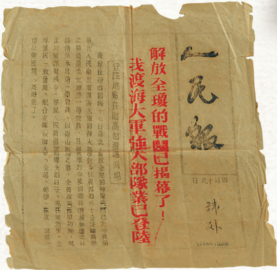
1950年4月19日,中共琼崖报刊《人民报》发表号外。

恢宏的历史,往往浓缩于时代的一个个细节之中。那些被尘封的记忆,总会在一件件文物中重新焕发光彩。海南省博物馆珍藏着1950年4月19日《人民报》号外等登载解放海南岛战役消息的旧报纸。这些陈旧泛黄的报纸记录了1950年4月至5月间,人民解放军渡海大军和琼崖纵队在海南各族人民的积极支援下歼灭敌军残余势力,带领海南人民获得解放的光辉历程。