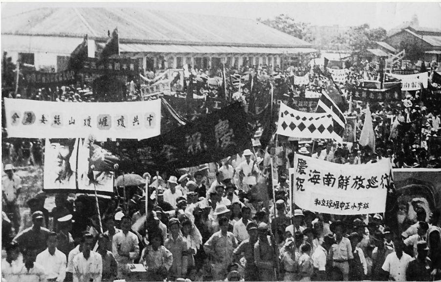
1950年,海口市和琼山县各界人士隆重集会欢庆海南解放。(资料图)

“海南岛解放后,人民欢天喜地,渡海大军和琼崖纵队战士经过之处,皆受到当地群众的最高礼遇。”王辉山分析,这个布