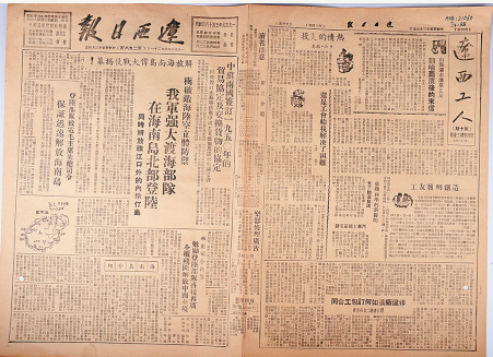
登载解放海南岛战役消息的《辽西日报》。