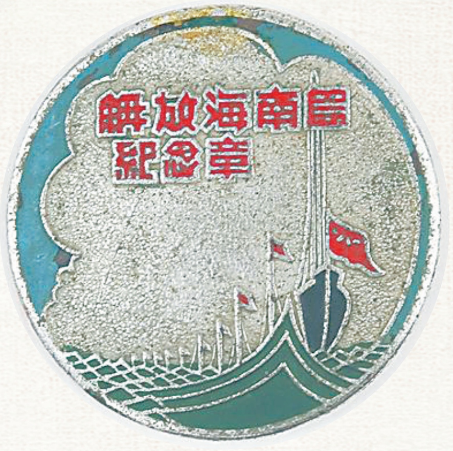
本版图片均为资料图 1950年解放海南岛纪念章。

在蓝天白云下,在波涛汹涌的海面上,一艘艘悬挂着红色“八一”军旗的木帆船正劈波斩浪迎面驶来……这是1950年解放海南岛纪念章的正面图案,象征着解放军战士向海南岛进军的壮阔场面,展现了解放军克服千难万险横渡琼州海峡的英勇场景。该纪念章目前分别珍藏于海南省博物馆、海南省民族博物馆等博物馆内。