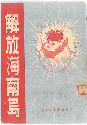
中南新华书店发行的《解放海南岛》。

1950年出版发行的《解放海南岛》和《乘风破浪·解放海南特刊》这两本红色文献为这一时期文艺作品中的典型,被作为代表性红色经典文物完好地收藏在我省文博单位中。日前,海南日报记者在海南省博物馆翻阅了以上两本红色文献的扫描件,了解作品创作背后的鲜活故事。