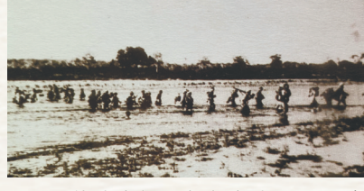
西线追击部队向南渡过昌化江，直奔北黎港。