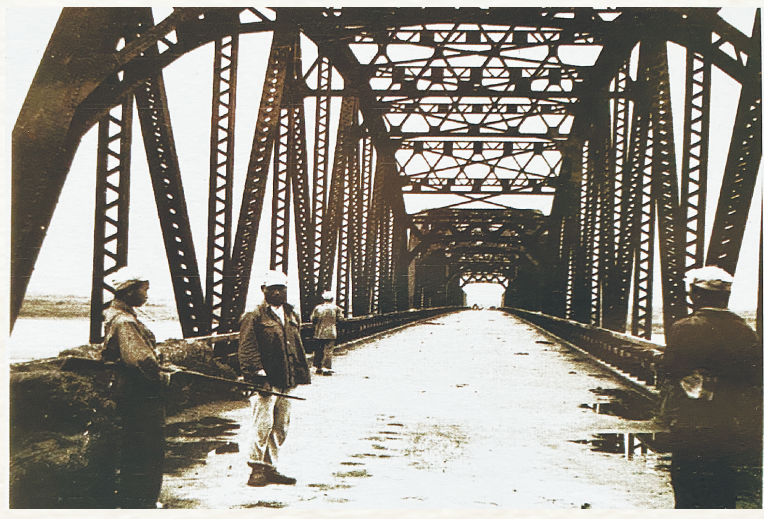
解放军接管东线吕宫桥，即日军当年所建的南渡江铁桥。