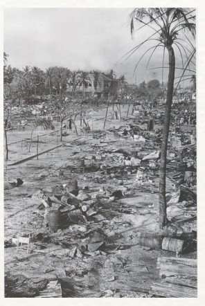
国民党军逃跑时，将榆林港破坏得一片狼藉。陈耿翻拍自《碧血琼崖照千秋》