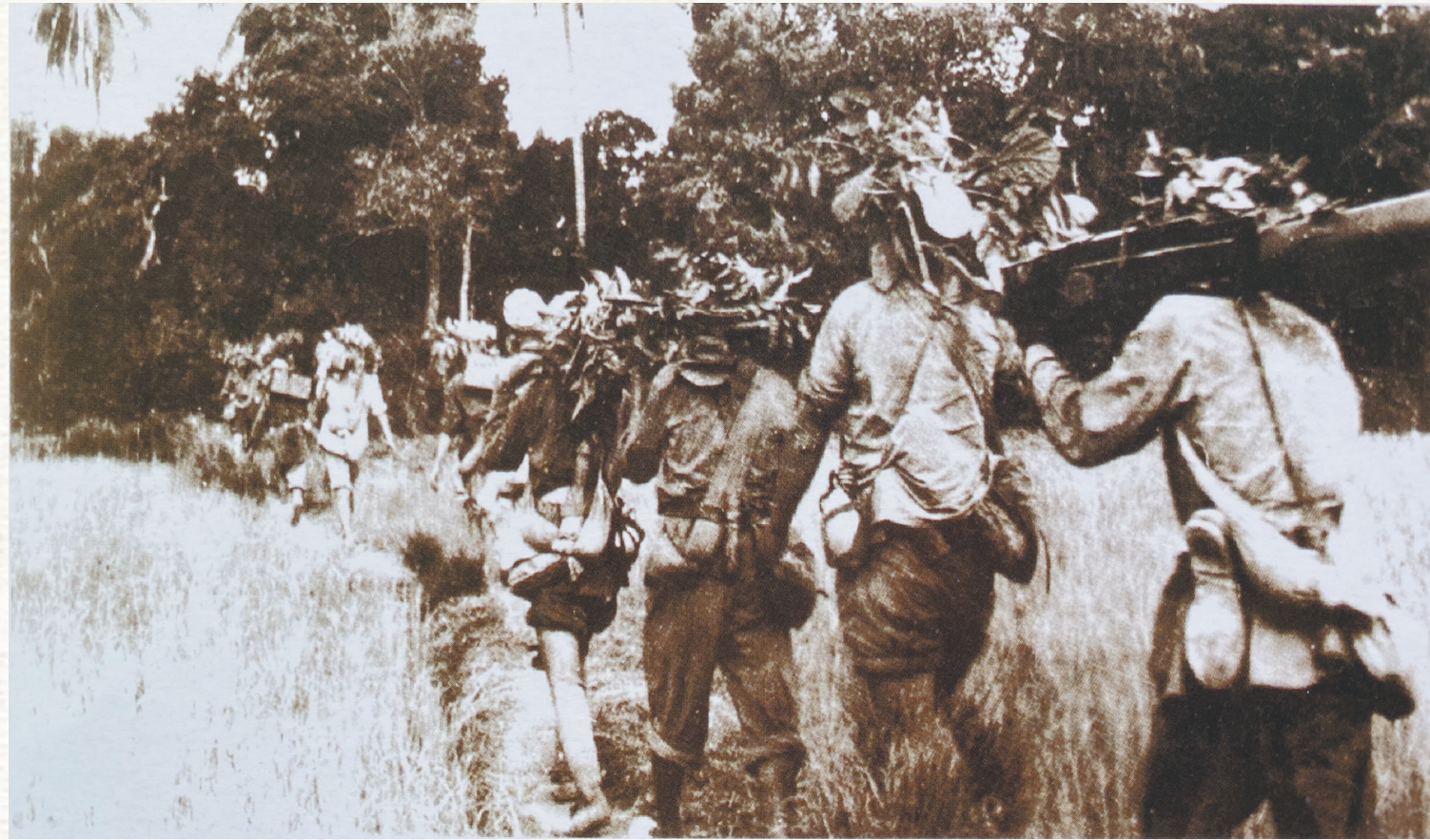
解放军中线追击部队不畏艰险，长途跋涉，一路追击国民党军。