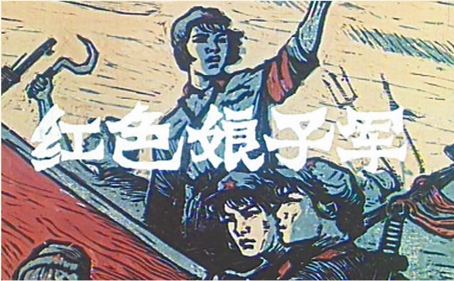
电影《红色娘子军》海报。

在以“红”色命名的红色文艺作品中,《红色娘子军》绝对是其中的佼佼者。在内容上,它是“琼崖革命二十三年红旗不倒”的缩影,预示了海南解放的必然性。在艺术上,继承了红色文艺创作的各种优良,经过多种文艺形式的表现之后,故事情节和表现手段日趋完美,影响力极为广泛,从而成为海南文化的金名片。