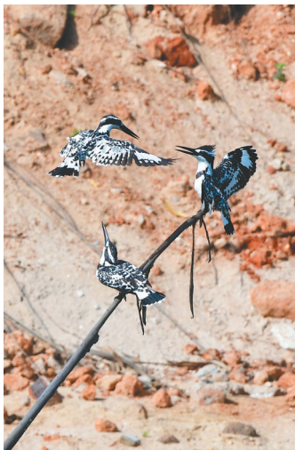
三只斑鱼狗在树枝上嬉耍。