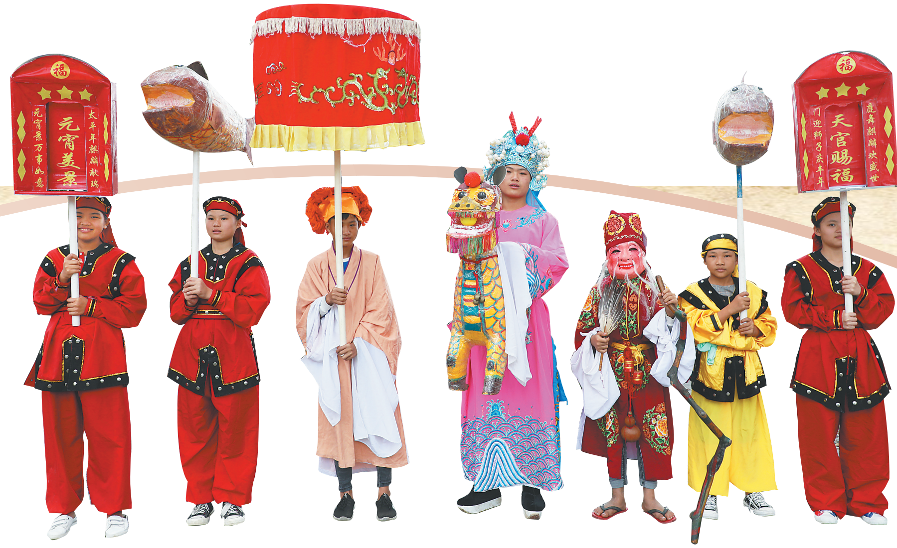
海南麒麟舞表演生动活泼、场面壮观。

如今，每逢节假日，吴清河便坐在村口的大树下，指导村里的孩子排练麒麟舞。以老带新的方式，让麒麟舞舞队不断发展壮大。年轻的舞队成员频繁外出表演，参加海口万春会等活动，海南麒麟舞被越来越多的人所熟知。