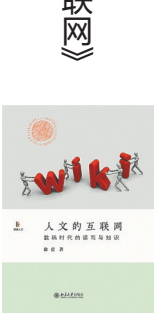
作者:徐贵 版本:北京大学出版社 时间:2019年7月

今年是南社成立110周年,南社作为近代最大的文学团体之一,对晚清民国的政治时局和文学革命都产生过重大影响。