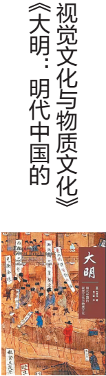
作者:(英)柯律格 译者:黄小峰 版本:生活·读书·新知三联书店 时间:2019年8月