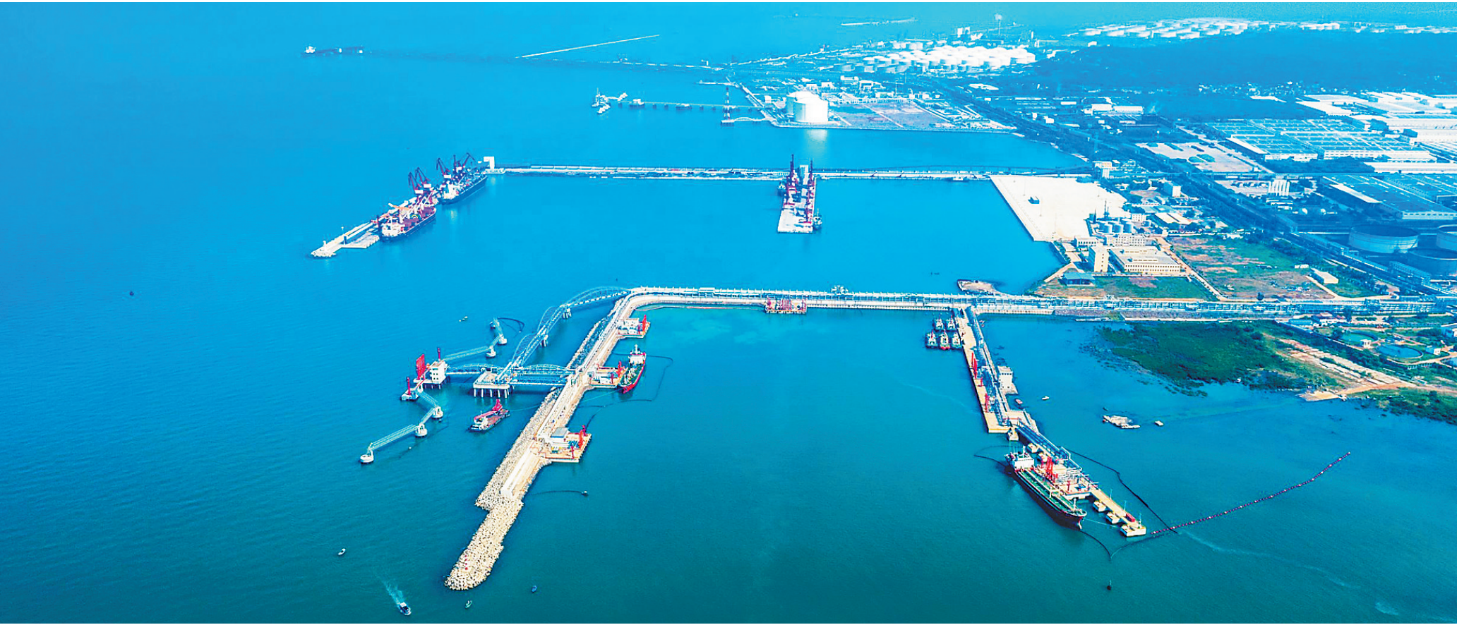
近日,俯瞰洋浦石化功能园区企业港池。去年下半年以来,洋浦通过打造石化产品外贸转型升级基地,主动对接国际贸易市场,创新开展多项新业务。

“我们会继续做好社保减免相关工作,切实缓解企业发展压力,同时积极落实企业2月已缴社保费退费工作。”洋浦社会保险服务中心社保关系科负责人邓玉霞说。